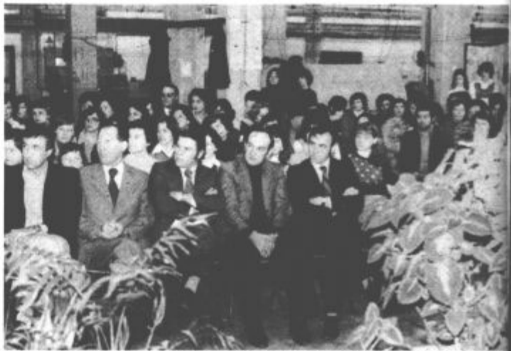
Delavci in gosti med proslavo, ki so jo obogatili še z modno revijo