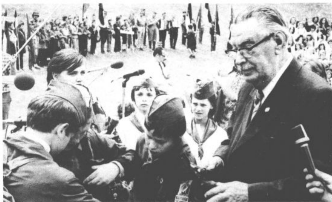
Tovariš Leskošek na enem izmed številnih srečanj s pionirji

Franč Leskošek je posvetil vse svoje življenje boju za socialno osvoboditev delovnih ljudi in za pravico, da sami odločajo o svoji usodi, za osvoboditev jugoslovanskih narodov in njihov gospodarski, družbeni in kulturni razvoj - Vodil je KP Slovenije v času, ko je zbirala delovno ljudstvo za skupni boj proti fašističnim osvajalcem in po okupaciji organizirala OF, ljudsko vstajo in s svojo dejavnostjo postala odločilni faktor v NOB in ljudski revoluciji, ki je omogočila razvoj in socialistično ureditev - V zgodovini slovenskega naroda bo ostal kot prvi komandant slovenske partizanske vojske in dosleden bореc v boju za gospodarski razvoj Jugoslavije in za socialistično samoupravno družbo.