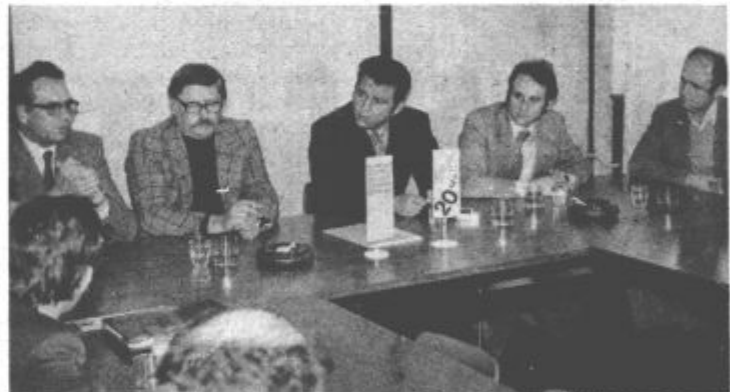
Predstavniki Gorenja in Vegrada med podpisom sporazuma

mentalni tovarni na Selu pri Velenju je že stekla. Tradicije gradbincev Vegrada in industrijske navade delavcev Vegrada pa morajo že kmalu pokazati prve rezultate skupnega dela pri razvijanju te nove dejavnosti v Šaleški dolini.