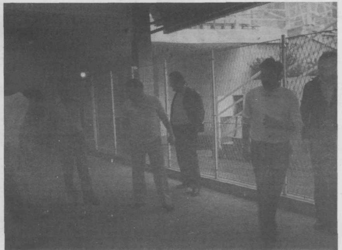
Ob 30-letnici Metalografičnega kombinata z Reke so se Saturnovci udeležili trim tekmovalja. Ekipa kegljačev, balinarjev, šahistov, nogometašev in strelcev so se pomerile s športniki Ine in domačini. Ekipa Saturnusa so se dobro odrezale, saj so razen v kegljanju osvojile vsa prva mesta. Tudi ekipno so bile prve. Priznanja so svečano podelili na proslavi delovnega jubileja kombinata.

Na sliki so balinarji na tekmi z ekipo MGK.