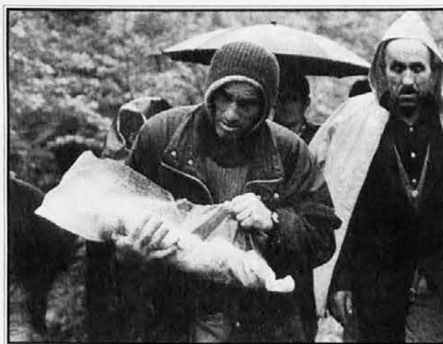
Kosovski Albanci pokopavajo novorojenčka.

Vse kaže, da se Milošević nikakor ni odpovedal staremu načrtu, katerega glavni smoter je doseči, da bo večina prebivalstva na Kosovu srb-