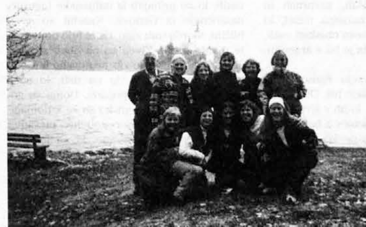
Skupina na Bledu

V odličnem razpoloženju smo prispeli na Brezje, kjer smo se v cerkvi s pesmijo zahvalili Mariji. Obljubili sva ji, da bova vsa ta najina doživetja s seminarja posredovali našim mladim in s tem gradili boljši svet.