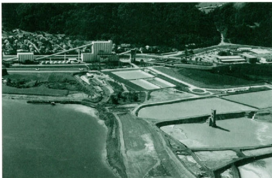
Premogovnik Velenje močno vpliva na okolje.

Na področju vod smo pregledali ravnanje s pitno in tehnološko vodo ter odpadno tehnološko in jamsko vodo. Pri emisijah v ozračje smo pregledali izpuste jamskega zraka v zrak, pri ravnanju z odpadki pa smo pregledali načine ravnanja s komunalnimi in jamskimi odpadki. Pregledali smo tudi načine ravnanja z nevarnimi snovmi in prekontrolirali ravnanje z odpadnimi nevarnimi snovmi. S področja transporta in logistike smo preverili načine prevozov delavcev in dostave materiala v jami in na površini, energetske področje pa smo osvetlili z vidika porabe toplotne in električne energije. Obremenjevanje okolja s hrupom smo preverili na področju ventilatorskih postaj. Preverili smo, ali pri projektih in investicijah upoštevamo tudi okoljski vidik in ali pri nabavi materialov in surovin