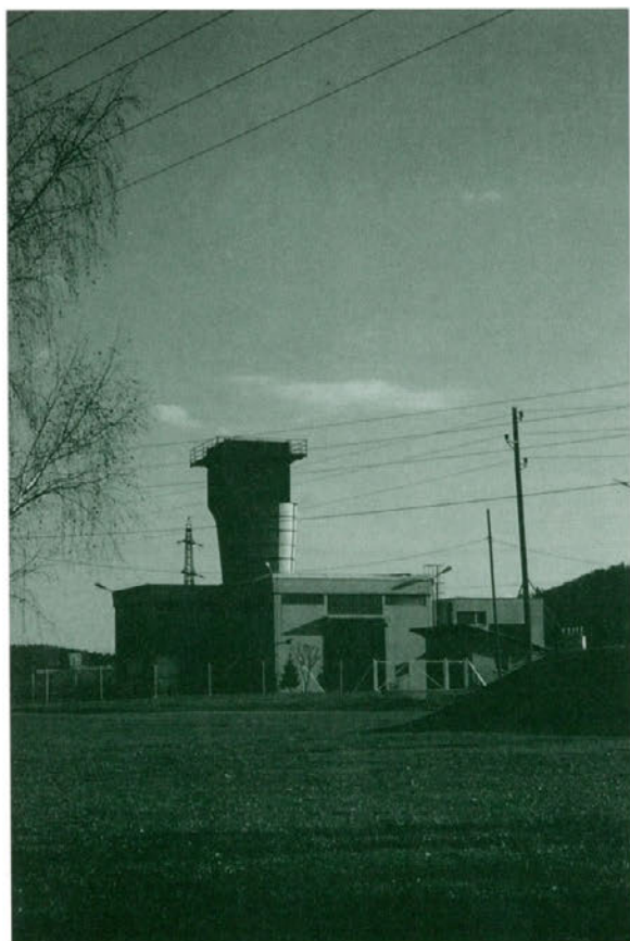
Ventilatorska postaja Pesje