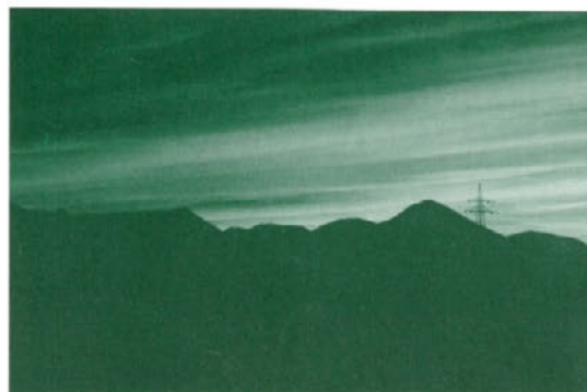
3. nagrada - Miran Beškovnik