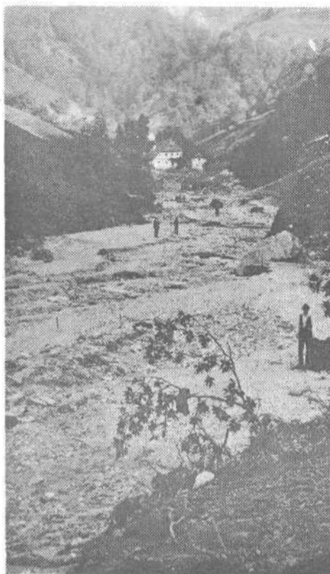
Mačkov graben po neurju 8. avgusta 1924. leta