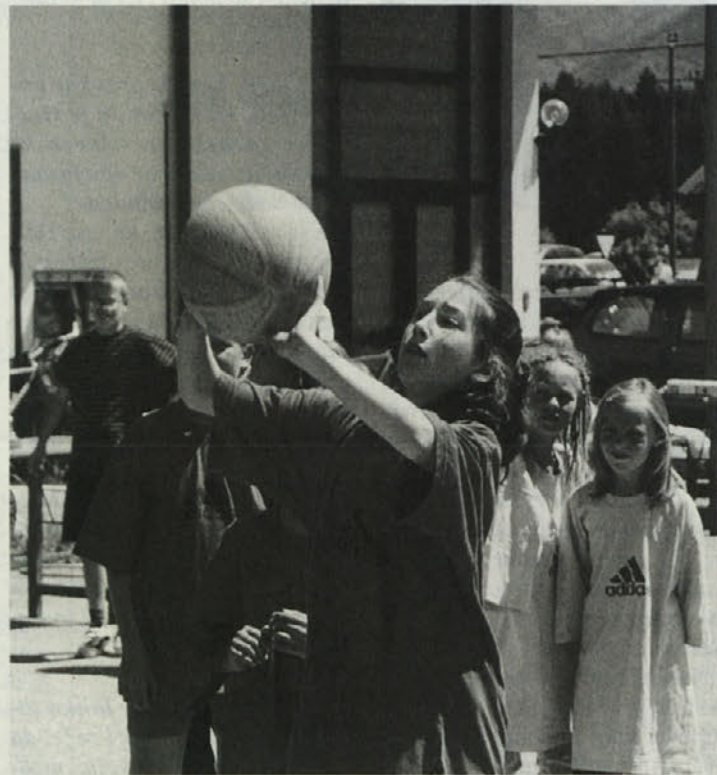
Polna koncentracija je vladala pri metanju v koš