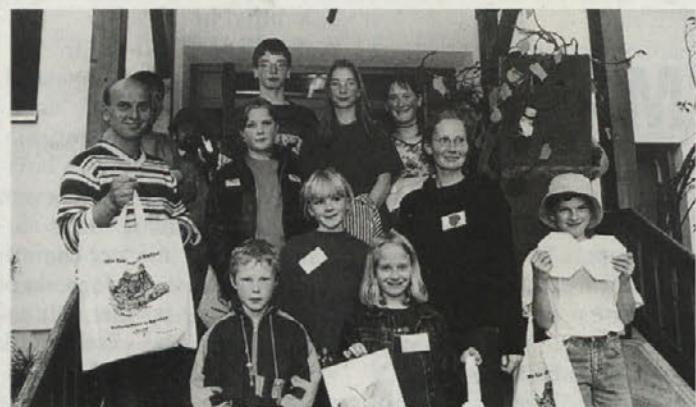
Veselite se po uspešnem zaključku prvega srečanja