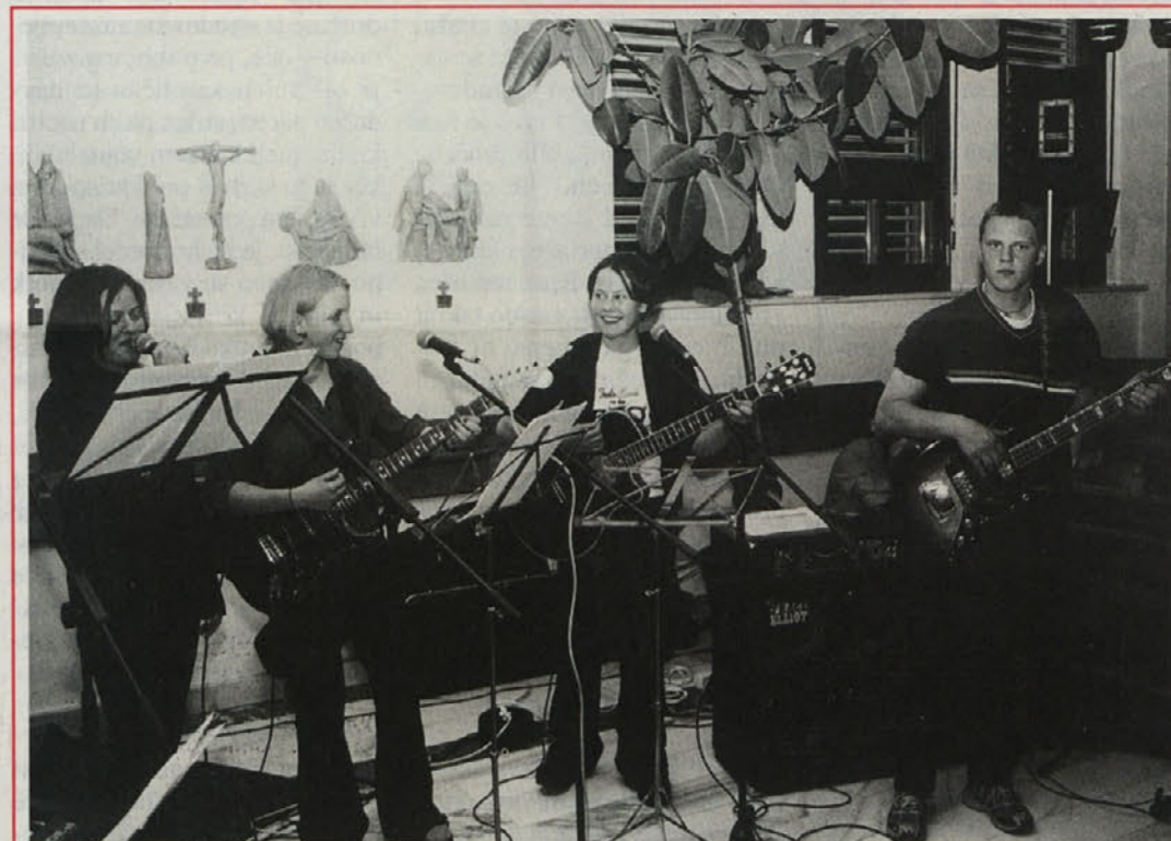
Višja šola za gospodarske poklice v Šentpetru pri Šentjakobu je ob zaključku šolskega leta pripravila zanimivo sklepno prireditev. Na sliki kvartet mladih glasbenikov, tekst na strani 5.