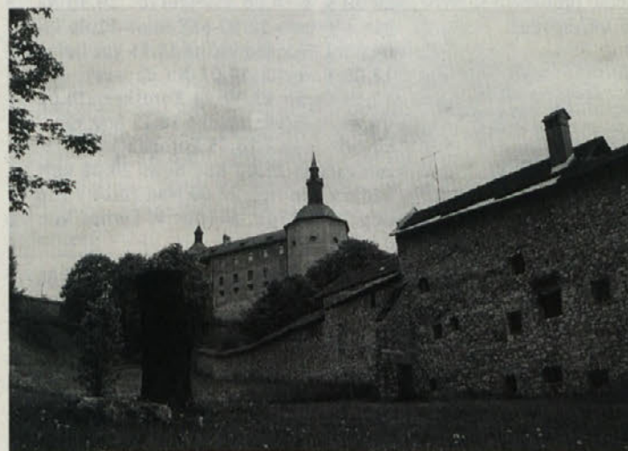
Škofjeloški grad iz nenavadne perspektive, ki so si ga učenci ogledali