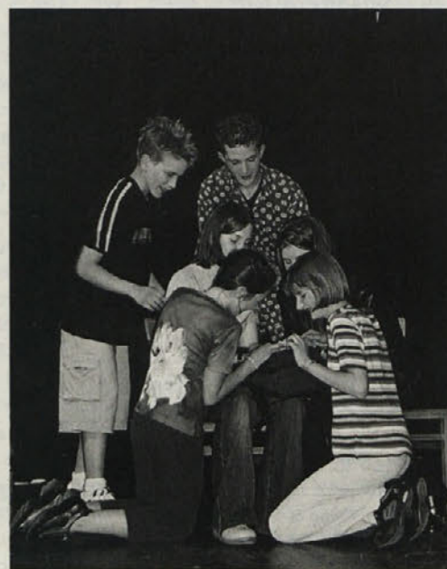
Glave skupaj, gre za pomembne stvari!