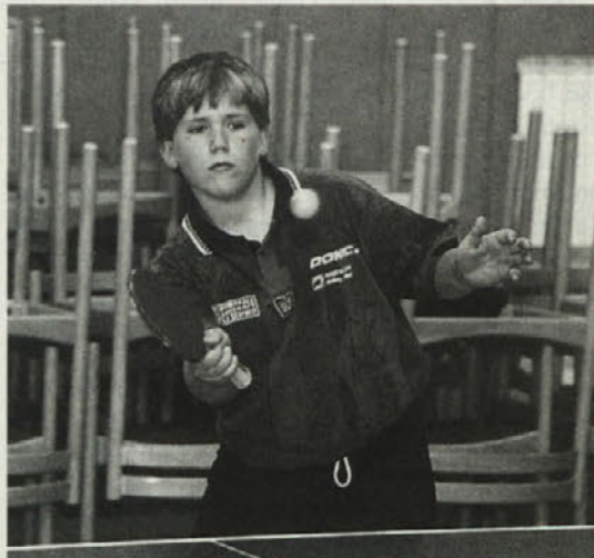
Tekme ob zeleni mizi so bile napete

Sportniki in športnice so se pomerili v štirih disciplinah: tek moških na 5 km po asfaltu, tek žensk na dogah, met košarkarskih žog v koš (dekleta) in namizni tenis (fantje).