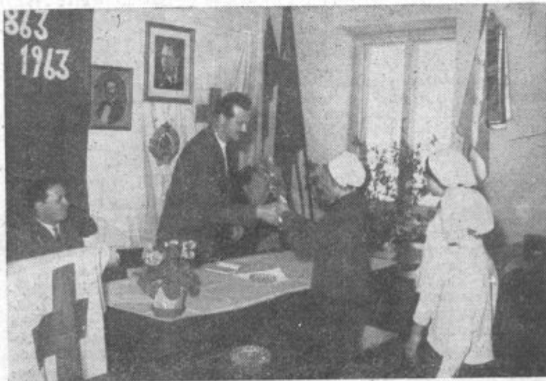
Podmladkarji RK predajajo šopke delovnemu predsedstvu občinske konference Rdečega križa.

Pred kratkim se je zadnjič pred splošno razpravo sestala občinska komisija za statut, kjer so sklenili, da se osnutek občinskega statuta da v javno razpravo. Komisija meni, da je potrebno v razpravo vključiti slehernega občana, ki ima pravico dati pripombe in predloge za spremembo osnutka statuta. Razprava bo trajala vsaj nekaj mesecev, tako, da bodo vsi občani lahko izrazili svoje mnenje o tem zelo važnem samoupravnem aktu komune. Te dni bo dan v prodajo natisnjen osnutek statuta. Občinski odbor SZDL bo sprejemal predloge organizacij, kolektivov, društev in posameznikov bodisi v pismeni ali ustmeni obliki vse dotlej, dokler ne bo objavljen zaključek razprave. Občinski odbor SZDL bo skupaj s krajevnimi organizacijami pripravil široko razpravo o statutu po vaseh, zaselkih ter družbenih organizacijah. V delovnih kolektivih pa bo vodil razpravo občinski sindikalni svet.