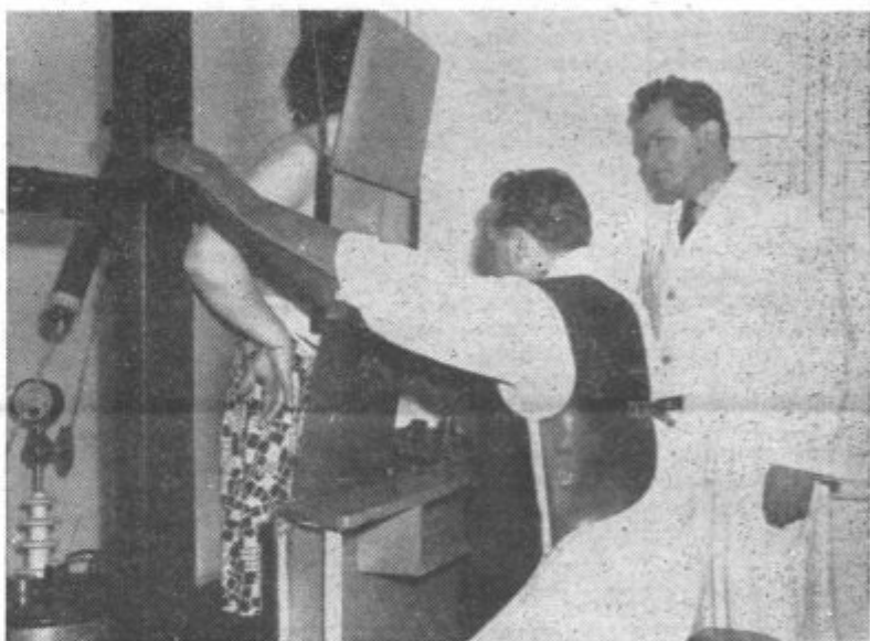
Organizacije RK v občini se zlasti uveljavljajo na področju krvodajalstva. Samo v Voličini, ki sodi glede tega med boljše organizacije, je lani kri darovalo 198 prebivalcev. V občini je leta 1962 778 krvodajalcev dalo 195 tisoč kubikov krvi. Na sliki: rentgenski pregled pljuč pred odvzgom krvi v Zdravstvenem domu Lenart.