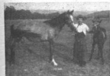
Fric Murgl med svojimi konjički

Pred dnevi se je za vedno poslovil od Gradiščanov dolgoletni gasilec in sedlar. V gasilski organizaciji se je uspešno uveljavljal polnih 33 let. Bil je tudi