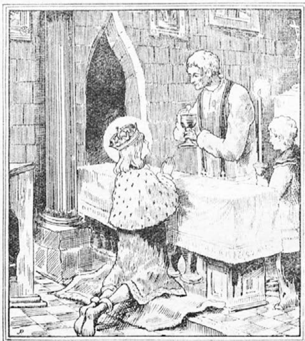
Sv. Kazimir pri mizi Gospodovi.

kapelo. Če ni bil pri starših ali sorodnikih zadržan, ali če ga ni domači učitelj poučeval, se ni mogel zdržati, da ne bi stekel za par trenutkov v kapelo Jezusa pozdravit. Celo ponoči, kadar se je prebudil, je skrivoma vstal in šel pred tabernakelj. Ko je prejel prvo sveto obhajilo, so priredili na dvoru veliko slavnost. Toda ves zunanji blesk ni imel za Kazimira nikakega pomena. Njegovo srce je vriskalo. Ali