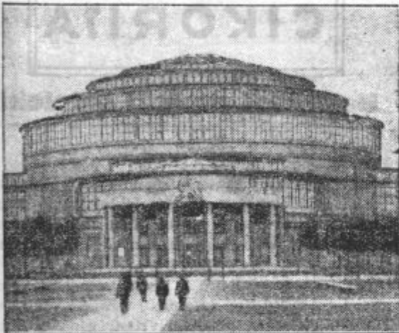
Ogromno razstavno poslopje velesojna v Vratislavi

Krasne cerkve v gotskem slogu z bogato notranjostjo v baročnem slogu dokazujejo moč nekdanjih knezov in vladarjev in blagostanje njenih meščanov. V Vratislavi stoje še celi stari deli mesta, ki so slikoviti tako, da se dajo primerjati le še z Norimberkom. In povsod pričajo še ponosne renesančne in baročne palače o starih trgovskih rodbinah in o njihovi vrednosti.