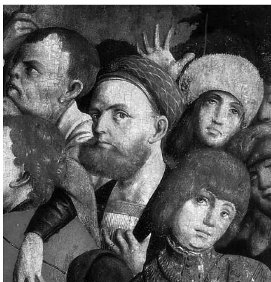
10. » Autoportret «, Mučeništvo svetnikov , Kranjski oltar. Dunaj, Österreichische Galerie, izrez