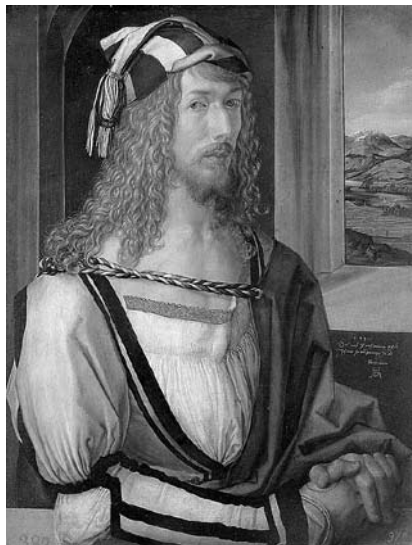
8. Albrecht Dürer, Avtoportret , 1498. Madrid, Museo del Prado

Ta tip figure pa se pojavlja tudi na freskah pri Sv. Primožu, in to celo ponovno kot spremljevalec ob Poklonu Sv. treh kraljev (sl. 9). Celoten prizor kaže na izredno izobraženost slikarja, saj osnovna kompozicija in posamezni detajli nedvomno sledijo Dürerjevemu lesorezu s tem motivom iz serije Marijino življenje, ki je v celoti v knjižni izdaji izšla šele leta 1511. 14 Grafični list je zanesljivo nastal okrog leta 1503, kar pomeni, da je moral biti naš freskant v neposrednem stiku s takrat najnaprednejšim likovnim centrom v srednji Evropi, torej z delavnico Albrechta Dürerja v Nürnbergu. Zelo podobno figuro najdemo tudi na tabli Kranjskega oltarja, hranjeni na Dunaju – skoraj enako je oblečen domnevni slikarjev avtoportret, umeščen med gledalce mučeniške smrti kranjskih zavetnikov (sl. 10).