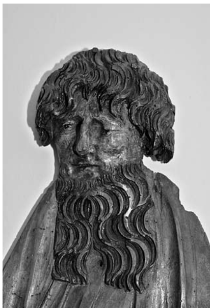
4. Sv. Pavel , zasebna last, izrez