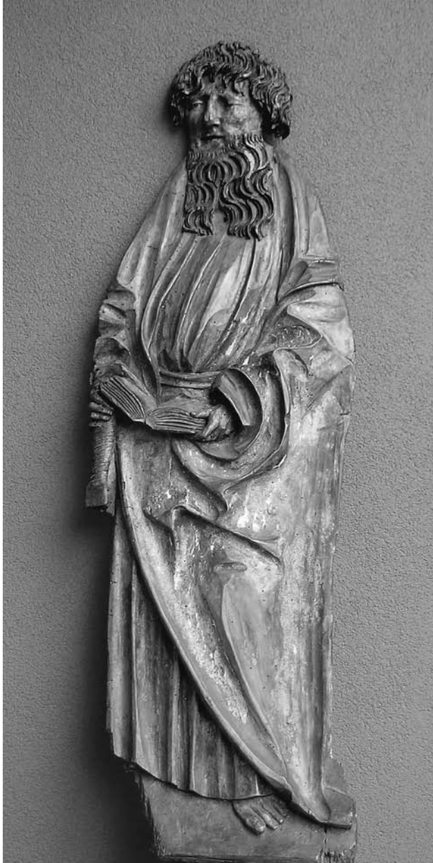
1. Sv. Pavel , zasebna last