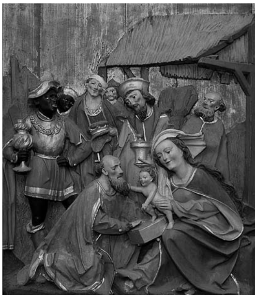
3. Poklon sv. Treh kraljev. Zgornji Tuhinj, župnišče