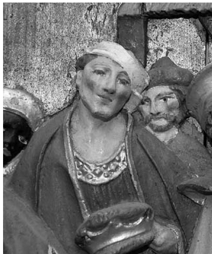
7. Spremljevalec pri poklonu sv. Treh kraljev. Zgornji Tuhinj, župnišče, izrez