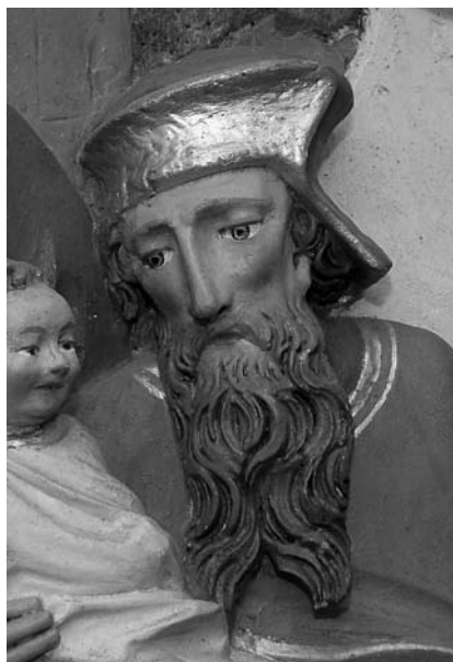
5. Simeon, Darovanje v templju . Zgornji Tuhinj, župnišče, izrez