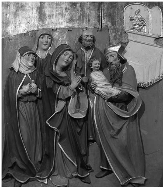
2. Darovanje v templju. Zgornji Tuhinj, župnišče