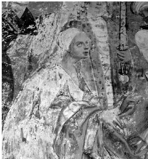
9. Spremljevalec pri poklonu sv. Treh kraljev . Sv. Primož nad Kamnikom, p. c. sv. Primoža in Felicijana, izrez