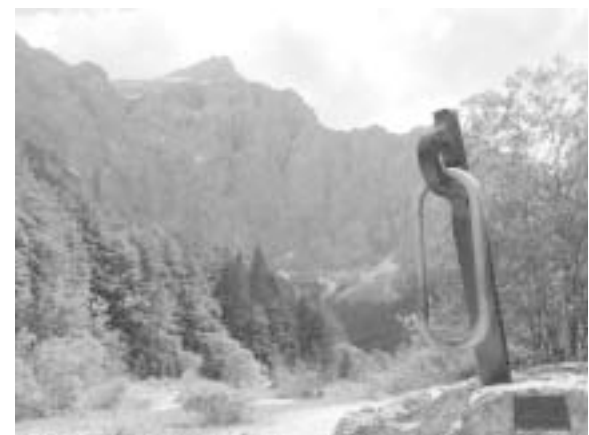
Spomenik padlim gornikom pri Vratih; v ozadju severna stena Triglava