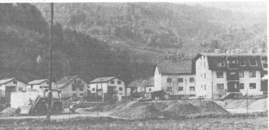
Novi del Horjula: komunala ima prednost

Za dodatne informacije pokličite telefonsko številko 061/571-861.