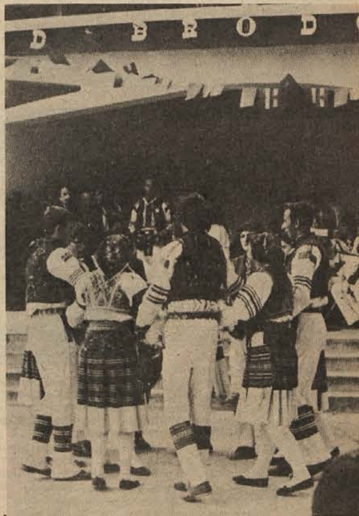
Neurje s točo, ki se je vsula med dežjem v nedeljo popoldne, je nekajkrat prekinilo folklorno revijo z okoli 300 nastopajočimi na kopalnišču na Loki v Novem mestu. Sodelovale so belokranjske in hrvaške folklorne skupine. Pokrovitelj je prireditev, ki je sodila v Dolenjsko poletje 71, je bil Dolenjski list. Na sliki: gostje iz Lazine so še imeli srečo, da so svoj spored odplesali na „suhem“