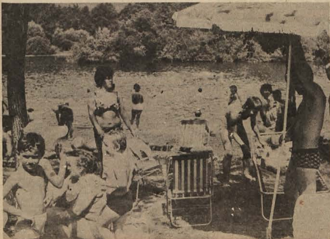
Velik travnik na Otočcu je bil v nedeljo premajhen za vse, ki so se prišli osvežiti v toplo Krko. Mnogi so s seboj prinesli senčnike, stole in mize, mnogi so pekli čevapčiče in ražnjiče