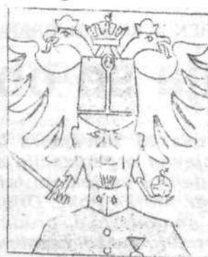
1917 Generalstabsmajor Leo Rupnik