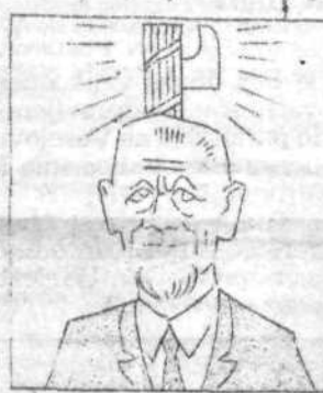
1942 IL-PODESTÀ LEONE RUPNIK