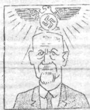
1943 Präsident der Provinzialverwaltung Leo Rupnik