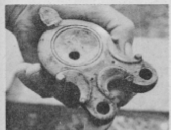
Otjenka, s katero so si Rimljani svetili, najdena na parceli bloka B-3.