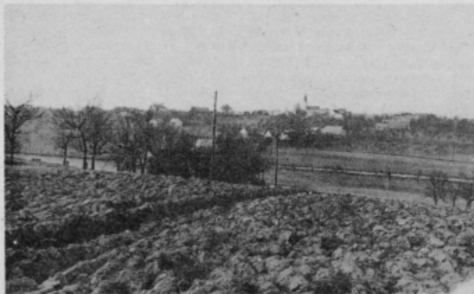
Sveže brazde, v ozadju Črešnjevce.

Če se krajevno središče Črešnjevce vse hitreje razvija v sodobno pozidano naselje, pa njegovo okolje te dni spominja na vzkipelo zemljo, saj ostaja le malo površin, kjer kmetijski stroji niso opravili svoje naloge. Letos, ko končujejo z regulacijo potoka Bistrice tudi na območju Črešnjevca, postajajo obdelovane površine za prebivalce teh krajev bolj „zanimive“, zato ni čudno, da so precejšnje travne površine že spremenili v rodovitna polja.