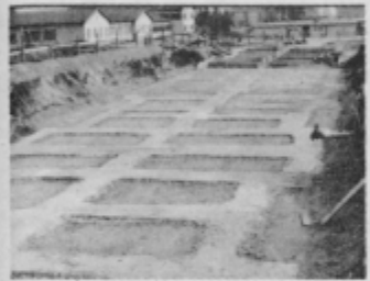
Temelje bodočega stanovanjskega bloka B-4 so prejšnji teden že zabetonirali.

Arheološka izkopavanja in gradnja novih stanovanj na območju zazidalnega okoliša Rabeljčja vas so vse do poslabšanja vremena tekla usklajeno in na obeh področjih uspešno. Upamo, da bo tako tudi za naprej, ko bo sneg skopnel in bo zopet posijalo sonce.