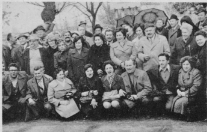
Brigadirji — veterani pred spomenikom MDB v Šamcu.

nost je bilo opaziti na obrazih veteranov. Naenkrat so začeli vzklikati: „to je naš most, tu je nasip, ki smo ga mi gradili...“ Na obrazih se jim je videlo, da so po-