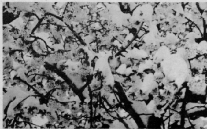
Čelajev cvet, en sam čelajev cvet...