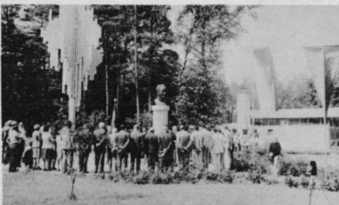
Pred spomenikom Borisu Kidriču v Kidričevem

Občani KS Kidričevo so že v mesecu praznovanja krajevnega praznika Kidričevega. Pričele so že razne prireditve in delovne akcije mladine, ki se bodo odvijale skozi ves mesec april v počastitev 6. krajevnega praznika, ki bo združen s 5. jubilejno razstavo cvetic, ki bo letos največja v naši republici, foto razstavo fotomaterjev o razvoju Kidričevega od leta 1945 dalje in likovni razstavi mladih iz šole in vrtca ter ostalih občanov.