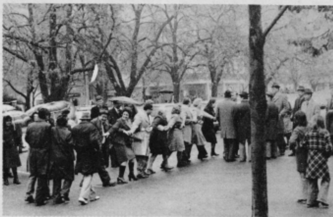
Čeprav je v Šamcu na rahlo rosilo so veterani zaplesali brigadirsko kolo kar v parku.