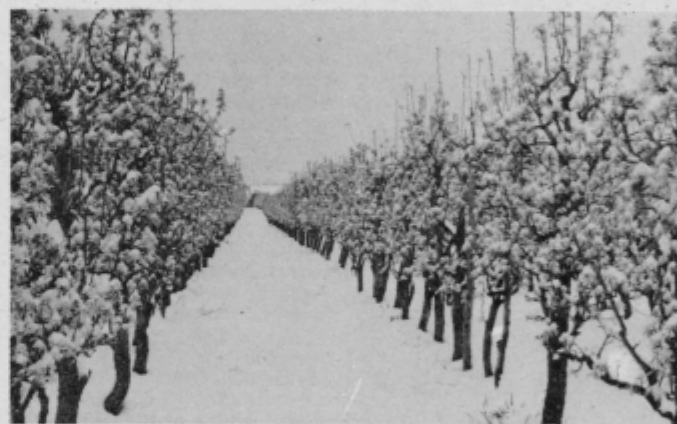
31. marec 1977 — cvetoči nasad hrušk na Panorami je prekrli sneg.

razvila tudi na ozimih, je škoda tukaj minimalna. Precej škode je v sadjarstvu in vinogradstvu. Ne pomnimo tako rane vegetacije, tako ranega brstenja. V najboljših letinah je bilo takšno stanje, kot je bilo sedaj v naših vinogradih in sadovnjakih, okrog 25. aprila. Ta-