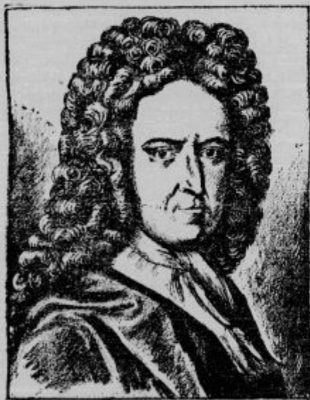
200 letnica smrti pisatelja Robinsona. Daniel Defoe, pisatelj svetovnoznanege »Robinzon Crusoe« — je umrl pred 200 leti, dne 26. aprila 1731 v Londonu, star 70 let. Defoe ni bil samo pisatelj, marveč se je pečal tudi s politiko. Zaradi politike je bil dalj časa zaprt. V ječi je ustanovil tudi časopis »The Review«, ki je zgled za mnoge angleške tednike.