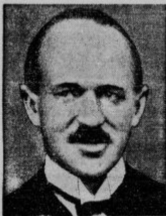
Felton Vesey Holt, namestnik angleškega maršala za zrakoplovstvo, je postal žrtev težke letalske nesreče. Nad Seahurst Parkom v Sussexu je letalo vicemaršala trčilo v neko armadno letalo in padlo na tla. Vicemaršal in njegov spremljevalec sta bila takoj mrtva.