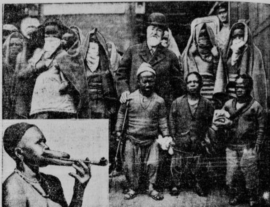
Cedni zamorci v Berlinu. Berlinski Zoo je dobil te uni žudne goste. Prišli so zamorci pigmejskega rodu iz Afrike. Zamorke imajo že zakrite obraze, izgledajo pa tako, kakor nam kaže slika spodaj na levi. Črne dame nosijo kot okraske že od mladosti naprej v ustnicah lesene deščice, tako, da izgledajo usta končno kakor ostudna loputa. Pa tudi nožje iz pigmejskega rodu niso nič lepši.

Ljubljana vsestransko napreduje. Na sliki je videti stroje, s katerimi lomijo na Selenburgovi ulici betonska tla, da bodo mogli speljati tramvaj.