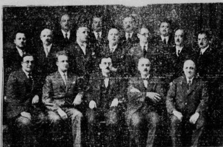
Nacestvo trgovskega gremija v Ljubljani. To društvo je praznovalo te dni petdesetletnico svojega obstoja.