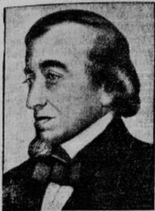
50letnica smrti angleškega državnika. Te dni je preteklo 50 let, odkar je umrl eden najpomembnejših angleških državnikov Benjamin Disraeli Earl of Beaconsfield. Njegova politika je bila na zunaj strogo imperialistična, na znotraj pa liberalna in posredujoča med strankami. Bil je trikrat zakladni kancler in dvakrat ministrski predsednik. Njegova zasluga je, da je postal angleški imperij močnega svetovna sila.