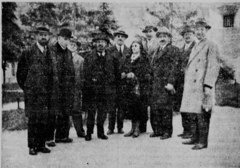
Albert Thomas, ravnatelj Mednarodnega urada dela, je nedavno prišel v Ljubljano, kjer si je ogledal predvsem socialno-delavstve ustanove.