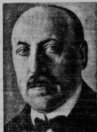
Matija Eldersch, predsednik avstrijskega parlamenta, je te dni umrl, star 62 let.