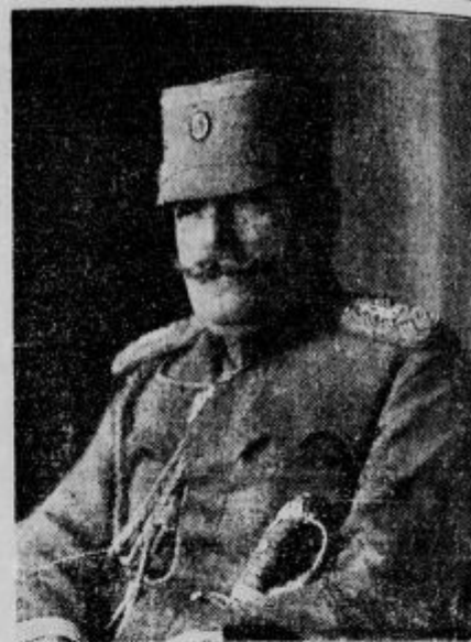
Naj dolgoletni vojni minister, general Steha Hadžić je 23. aprila v Belgradu na naglo umrl.