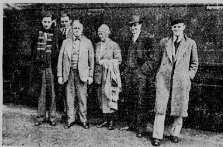
Angleški igralci so nedavno obiskali Ljubljano, kjer so mojstrsko uprizorili svetovno znano Shakespearovo dramo »Hamlet«.