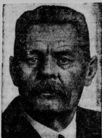
Maksim Gorki, znani ruski pesnik, ki je prej simpatiziral s socialno demokracijo in v prvih letih po revoluciji odločno odklanjal boljševizem, je prosil za sprejem v komunistično stranko Rusije.