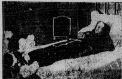
Infantinja Izabela Španska na nirtvaskem ožru. 79 letna teta španskega kralja Alfonza, Izabela, je pretleko nedeljo umrla v Parizu.