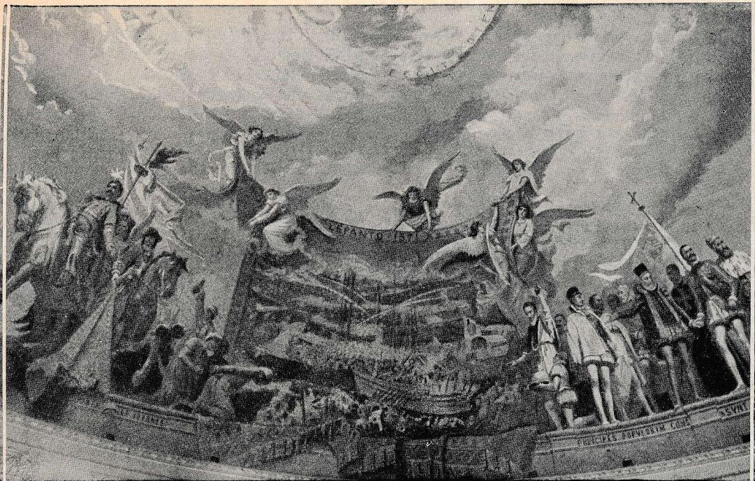
Bitka pri Lepantu na sliki v kupoli svetišča Marije Pomočnice v Turinu.

tovščino se je v teku let vpisala cela vrsta knezov, plemenitašev in veliko število drugih vernikov. Leta 1737. je štela po vsem svetu več kot tri milijone udov.