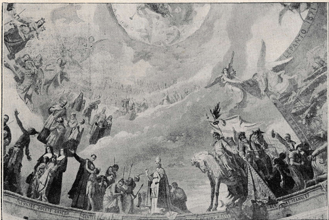
Poljski kralj Jan Sobieski na sliki, ki predstavlja zmagoslavje Marije Pomočnice. (Slika na presno v kupoli svetišča Marije P. v Turinu.)

proti Dunaju velikanska turška vojska. Stela je blizu 300.000 mož. Vodil jo je veliki vezir Kara Mustafa. Oholi turški suitan Mohamed IV. je namreč sklenil prodreti preko Dunaja in reke Rena, da bi si tem laže osvojil Italijo ter posebno glavno mesto krščanstva — večni Rim. Kakor so pred 160 leti spravili podse Belgrad in 50 let kasneje Budimpešto, tako naj bi sedaj