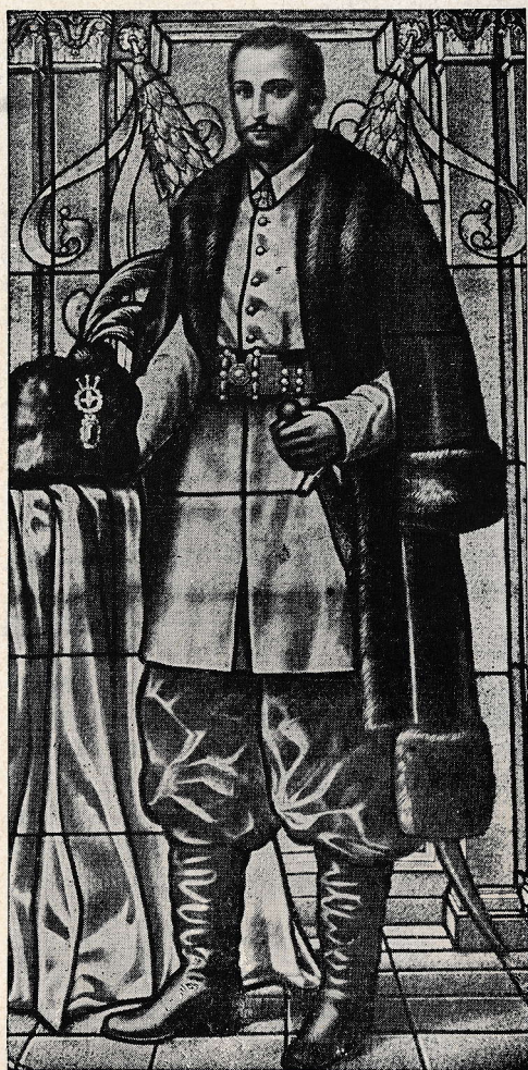
Turin: Podoba kneza Avgusta Czartoryskega v cerkvenem oknu v svetišču Marije Pomočnice.

O veliki noči leta 1875. je napravil duhovne vaje po načinu sv. Ignacija Lojolskega. Ko je bral življenje sv. Alojzija Gonzaskega in sv. Stanislava Kostka, se je še bolj utrdil v goreči