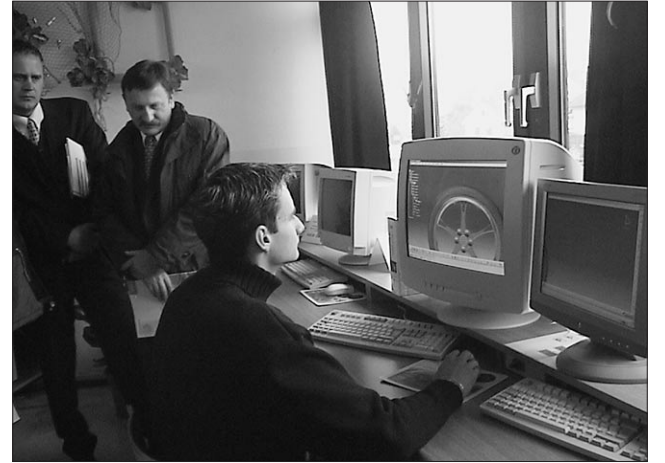
Dijak pri delu s Catio V5

MLADINSKA KNJIGA / ZBIRKI SINJI GALEB IN KNJIGOŽER