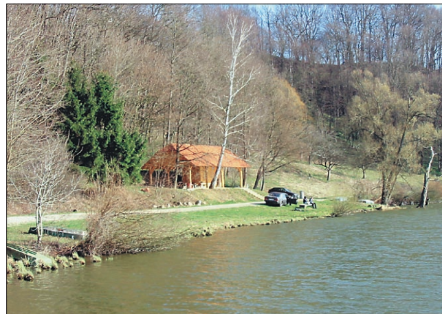
Turistični dom nudi gostoljubje članom društva in vsem izletnikom, ki jih zamikajo lepote trojiške okolice

COGETINCI / GRADNJA HIŠE ZA DRUŽINO ANŽELJ-PODGORŠEK