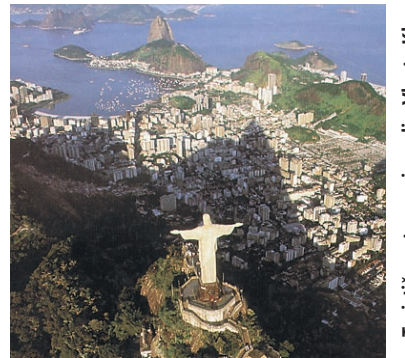
Turistično stran pripravila Vlasta Klep

Vendar neupogljiv duh Ria de Janeiro preveva tudi njegova naselja kolib. Na obeh koncih - tako v favelah kot bogataških četrtih - je Rio mesto glasbe in plesa. Živahna brazilska ljudska glasba se razlega povsod; nam najbolj znani sta bossa nova in samba. Znamenite šole sambe, no, bolj plesni klubi kot šole, so pogosto v favelah. Plesalci se urijo pozno v noč, pagodes (nastope s sambo) pa prirejajo na peščinah. Prav tako utrjena navada je brazilske navdušenje za šport, zlasti za futebol - nogomet. Veli-