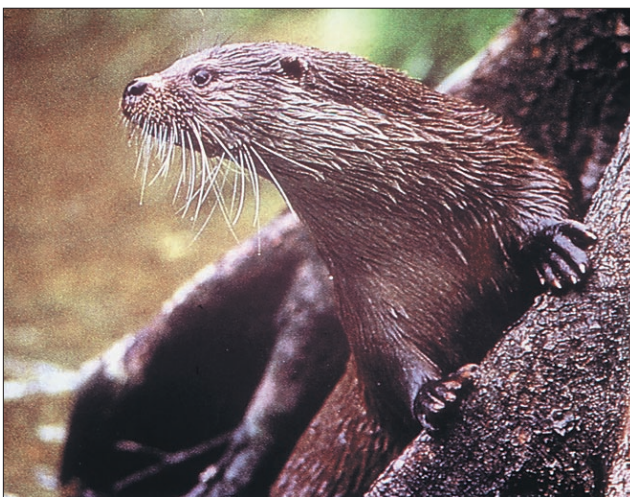
Vidre velikanke imajo prelep kožuh, ki jim ga zavida vsaka ženska

in našli svoje zadnje pribežališče v zelenem pragozdu. Sledili so jim Španci, ki so iskali nova bogastva. Oboji so naleteli na pragozdna plemena. Ledena negibnost otokov prazgodovine je bila grobo prekinjena. Na eni strani so se srečale puške in železna rezila, na drugi orožje iz lesa in kosti. Divjaki so se pred močnejšim nasprotnikom umikali in vdiral na območja plemen v notranjosti gozda. Tisočletni red in mir je bil podrt. V tišini pragozda so odmevali