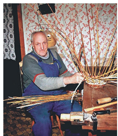
Lenc s cejnami, ki so namenjene za vstavitev priložnostnih daril

da Lenc ni ostal brez dela. Dnevno mu ljudje pripeljejo "pintovec", to je vrsta rdeče vrbe, iz katerega vsak dan spleto pet košev ali po šest "cejn" ali "pletterk" (to je košara z "locnom"). Kot pravi, od tega ni obogatel, obogati pa vsak svoj upokojski dan.