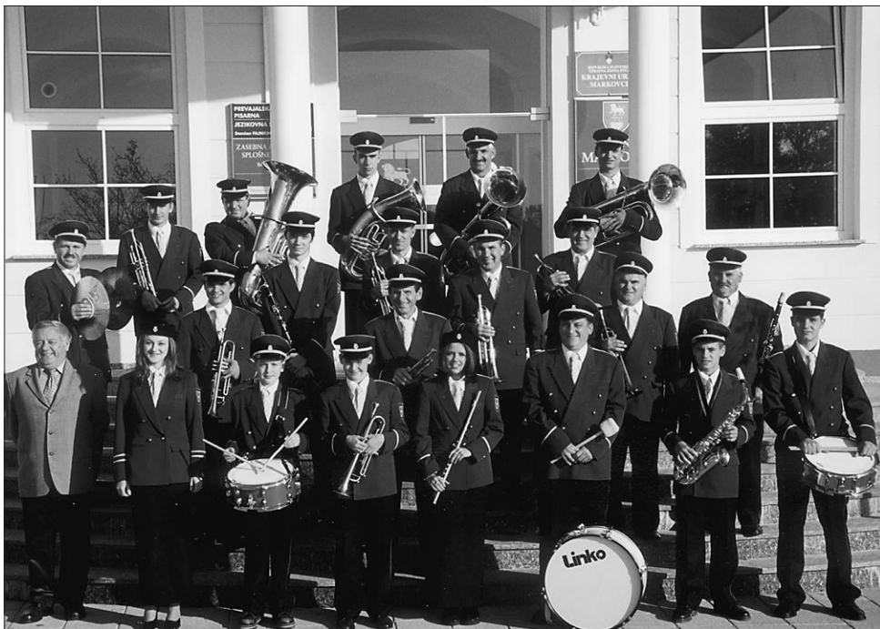
Godba na pihala občine Markovci (pred stavbo občine).