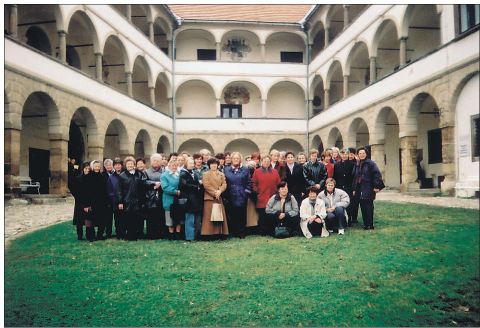
Udeleženske ekskurzije pred veličastnimi arkadami ptujskega gradu

Sicer kratko, a pestro zgodovino je Društvo podeželskih žena občine Podlehnik opisalo v zloženki, ki so jo izdali prav ob letošnji desetletnici. Namen zloženke je širša predstavitev dejavnosti društva in vabilo novim članicam, ter seveda ta, da bo prijetna in koristna dejavnost društva ostala zapisana tudi za prihodnje rodove.