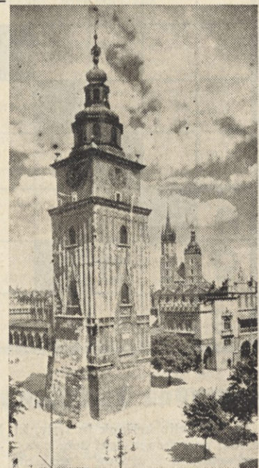
Marijina cerkev s krono v premeru devetih metrov v konic, ponos mesta Krakowa

Na poti v domovino smo se ustavili v tovarni smrti — Auschwitz. Od Krakowa je oddaljen 60 kilometrov. V vojni je bila to popolna mašinerija za ubijanje ljudi, danes pa je tragičen dokument, spomenik in nema priča nasilstva in barbarstva nacistov.