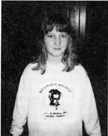
Otroci Balantičeve šole v priložnostnih trenerkah