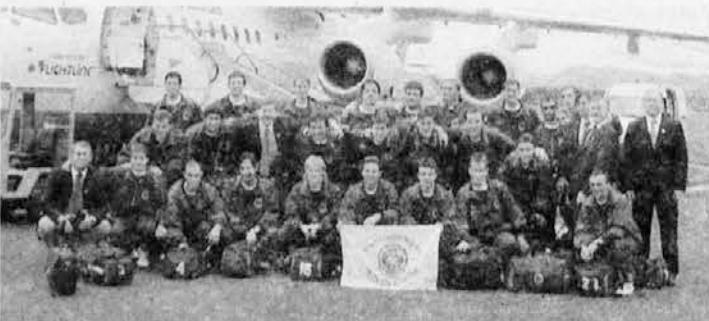
Ker je v zadnjici ta slika tehnično slabo izpadla, jo ponavljam: Nogometna ekipa ob prihodu na Brnik

Sploh je bil nastop naših fantov v celoti, tudi v obnašanju na igrišču, zelo korekten.