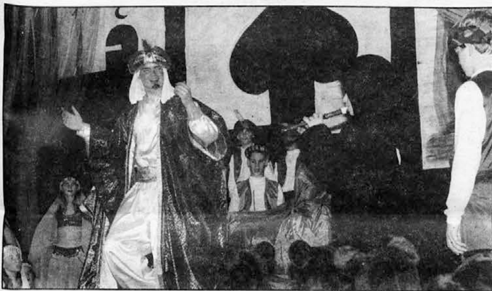
Obe sliki: iz igrice Paša in medved