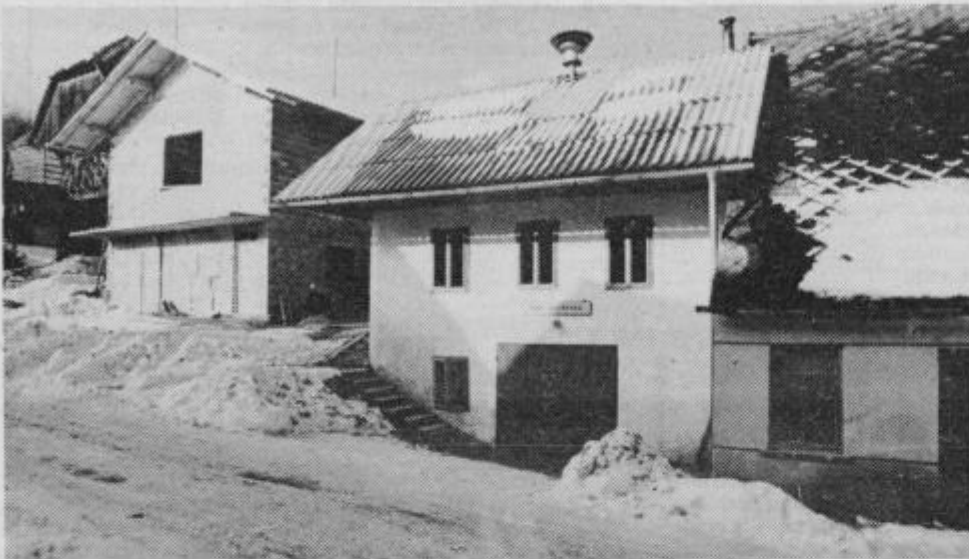
Sredi vasi bo skromen «gasilski golobnjak» kmalu dobil večjega in sodobnejšega tekmeča. V tej hišici je bil med vojno in po njej sedež takratnega Krajevnega ljudskega odbora.

Toda to je bila le polovična uresničitev njihove želje. Makadamsko izvedbo so imeli le za začasno rešitev