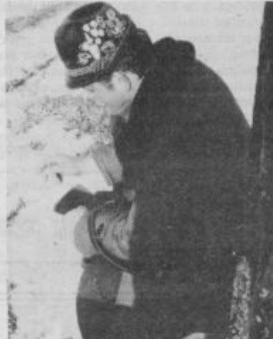
Brez plena utrujen... Bo pa drugič kaj več!