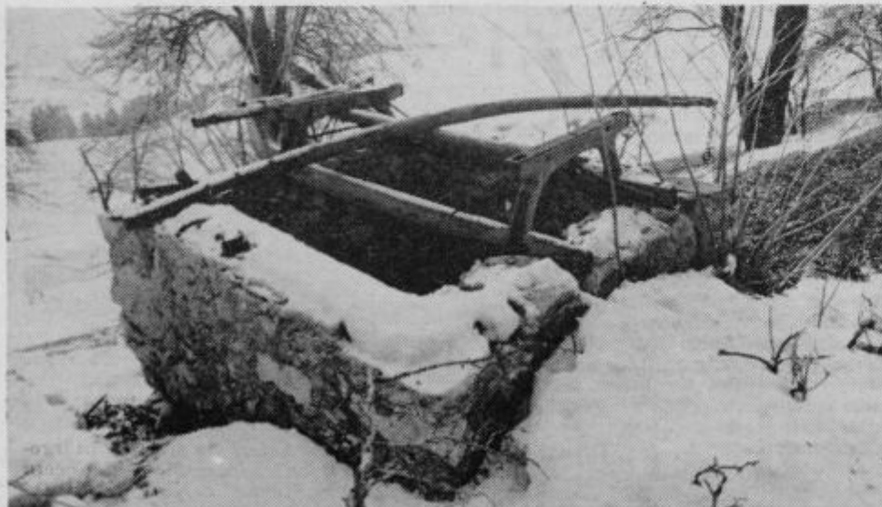
Spominek na preteklost. Odslužena sadna sušilnica in na njej odslužene vprežne sani, kajti tudi tu so konji zgubili s traktorji.