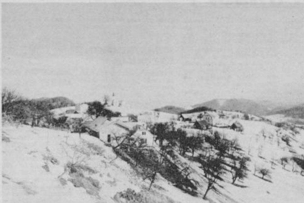
Prijazna hribovska vas Vrh je dočakala prve, tako težko in krvavo zaslužene pridobitve, ki jim bodo omogočile še hitrejši razvoj.