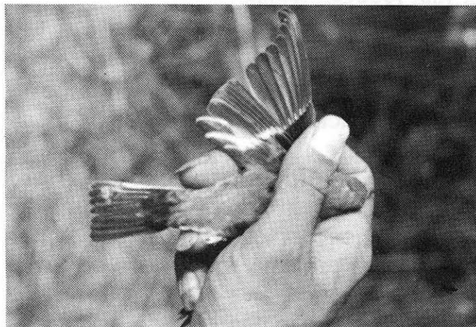
Črnoglavi muhar ♂ prvoleten Pied Flycatcher ♂ first-year