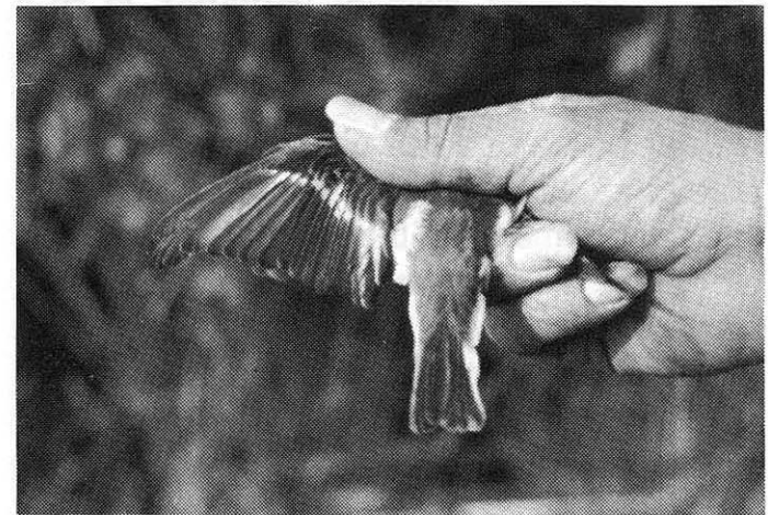
Črnoglavi muhar ♀ prvoletna Pied Flycatcher ♀ first-year