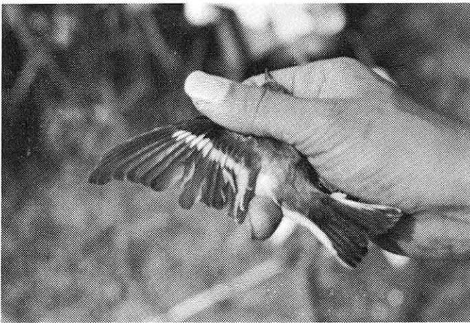
Belovrati muhar ♂ prvoleten Collared Flycatcher ♂ first-year