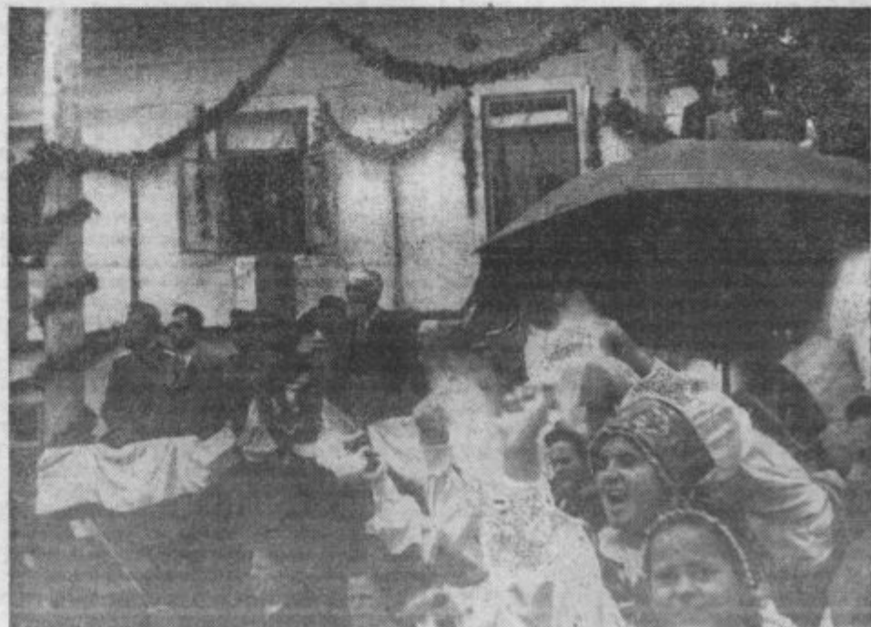
Kjerkoli se pojavi g. prezident na zborovanju, ga množice pristrčno pozdravljajo in navdušeno sprejemajo njegove jedrnate besede