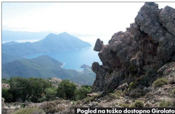
Pogled na težko dostopno Girolato

Le nekaj sto metrov pred vasjo sva si privoščila še zadnji postanek, saj sva bila tako utrujena, da bi se