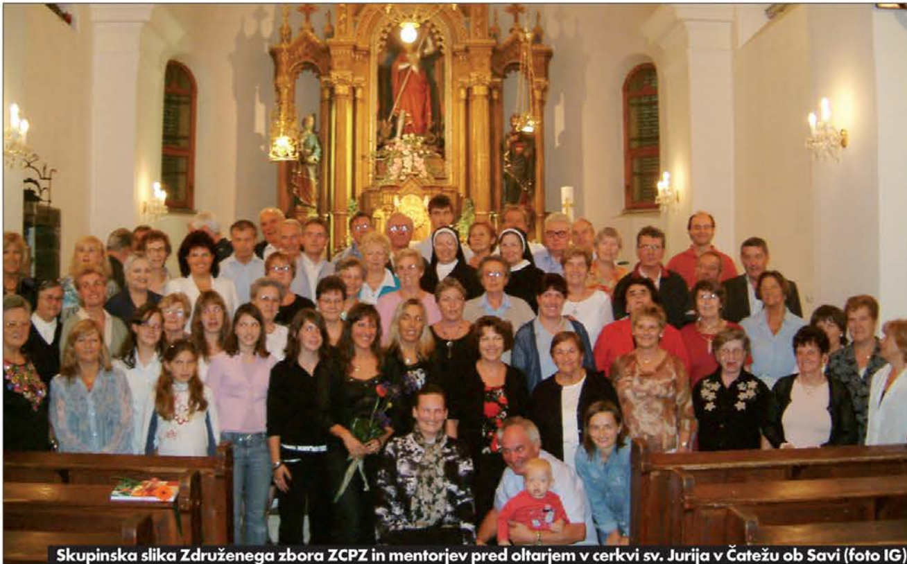
Skupinska slika Združenega zbora ZCPZ in mentorjev pred oltarjem v cerkvi sv. Jurija v Čatežu ob Savi