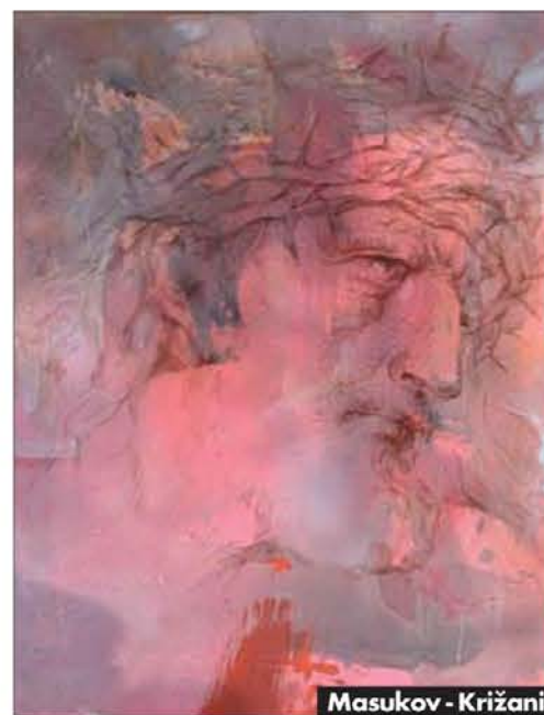
Masukov - Križani

obiskovalcev za en dan in darovalcev je bilo kar 58, med njimi je bila večina udeležencev prejšnjih kolonij. Darovali so 81 likovnih del z ocenjeno vrednostjo 2 mio. SIT. Dan odprtih vrat je bil namenjen tudi številnim obiskovalcem, tudi prvim kupcem, saj je bilo prodanih 13 slik v skupni vrednosti 1,1 mio. SIT. Dan se je zaključil s