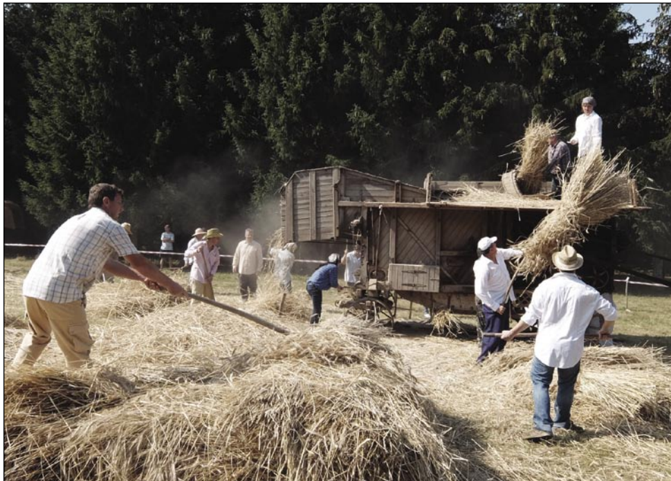
Gda je indasvejta k iži mašin prišo, je svetek biu, ka se je mlatilo žito, stero je zagotovilo držini krü. Pri težkom deli so pomagali sausedge pa žlata tō. Andovčarom so tō pomagali sausedge iz Dolejnc, Verice, Števanovec, Sakalauvec pa Gorenjoga Senika.

Zmejs so prejkдали priznanja »Za Porabje« tō. Letos so si tau válo zaslužili ustanovitel Slo-