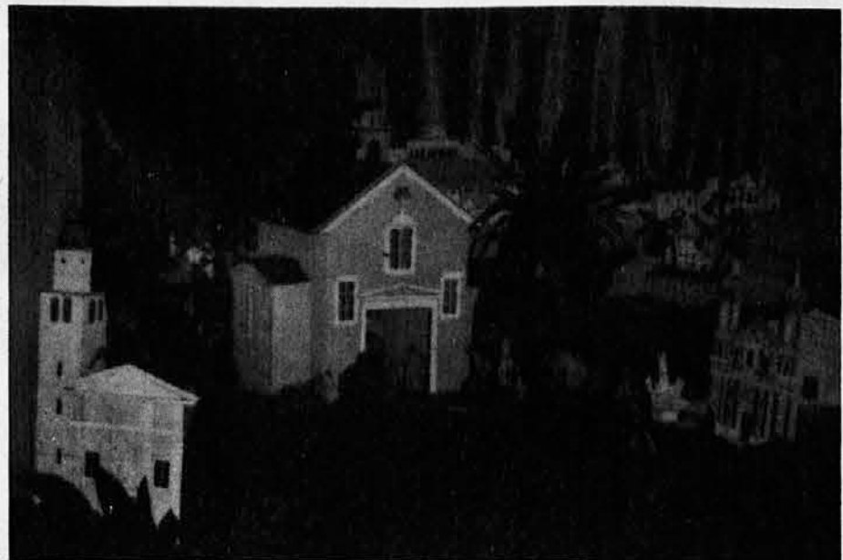
Letošnje jaslice pri Sv. Ivanu v Gorici so izvirne in animirane. Poleg palestinskega ozadja izstopajo cerkve v miniaturni, kjer so slovenske maše v mestu. Skupina mladih, ki jih je izdelala, je hotela obiskovalce opozoriti s svetoletnim sporočilom: Odprite srca Kristusu, ki prihaja za nas posebno med sv. mašo. Tudi zvonovi vabijo. Poleg tega je na jaslicah vse polno premikanja in svetlobnih efektov med dnevom in nočjo. Priporočamo ogled jaslic. Cerkev je odprta zjutraj do 12. ure, zvečer pa od 18,15 do 19,30. Podrli jih bodo po svečnic - 2. februarja