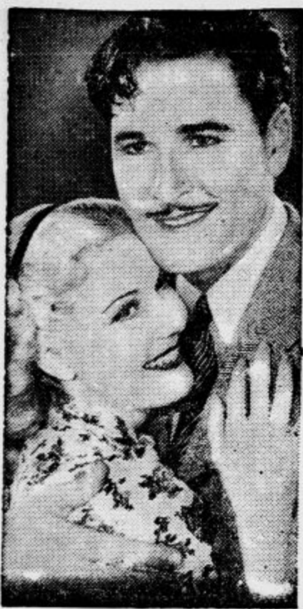
Takšen film nam obeta v nekaj dneh kino Matica »Luč v megli« se imenuje. Z njegovim naslovom je simboličen in značilen, kajti ta film bo res luč v megli življenja.

Malo je filmov, ki bi človeku dali novega optimizma in mu nudili nekakšno oporo v boju z življenjem, saj so po večini zabavne ali zgodovinske vsebine. Zato moramo takšne filme še dvakrat pozdraviti.