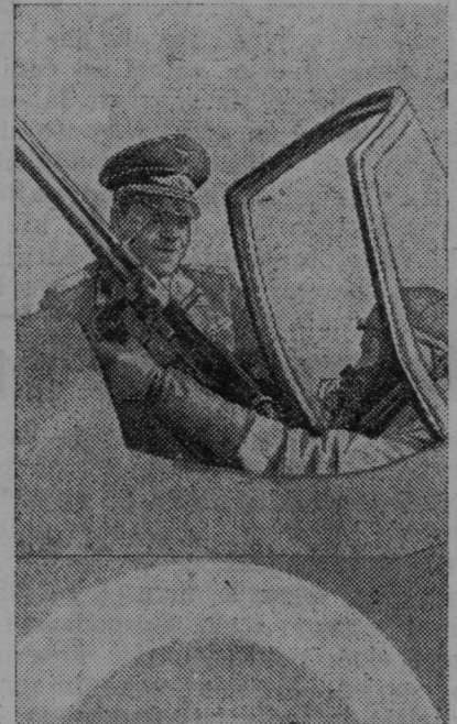
Nemški letalski general Milch v Londonu. Na sliki vidimo, kako razkazujejo generalu angleška bombna letala.

Ob koncu stvarnega govora je izrekel g. ban prisrčno častitko in pohvalo Sadjarskemu in vrtnarskemu društvu, številnim podružnicam društva in sadjarjem, ki so priredili z veliko vnemo in požrtvovalnostjo sadno razstavo in sadni sejem v Mariboru.