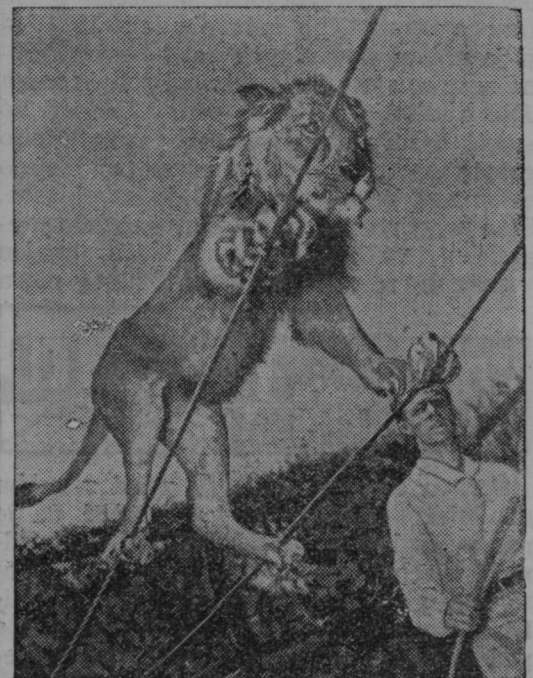
Dveletni lev pleza po vrvi v velikem cirkusu v Kaliforniji v Združenih ameriških državah.