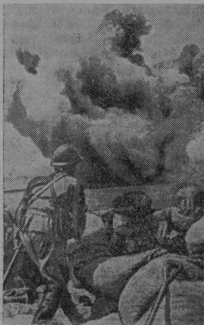
Udar letalske zažigalne bombe pred Šangajem.