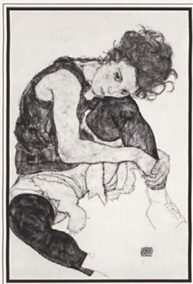
Egon Schiele: SEDEČA ŽENSKA Z UPOGNJENIM KOLENOM, 1917

Morda je "popolna Sreča" dovolj velik razlog za kazen ali pa je strah pred tistim, kar je nepredvidljivo, v njenem primeru Andrej in njuna porajajoča se Ljubezen, dovolj, da se človek prestraši in zbeži. Ali pa je zgolj sla po Smrti tisto, tako zelo narodno in ponavljajoče, za kar se je Mirjam raje odločila, kot pa da bi se poizkusila spoprijeti z nečim neznanim in lepim.