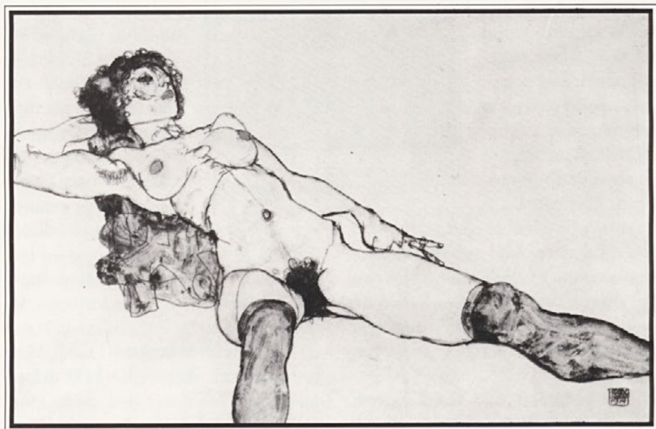
Egon Schiele: ZLEKNJENA GOLA ŽENSKA Z RAZKREČENIMI NOGAMI, 1914

Marber s fikcijo svoje dramske zgodbe ne beži pred kompleksi, temveč jih problematizira, jim poskuša priti do dna. Njegove figure so iz mesa in krvi. Naslov Bližje opozarja na čustva, na toplino, hkrati pa govori, da mora uprizoritev v bližino okleščenosti, hladu, laži in prevar, ki so kamnita snov nas samih in naše bližine.