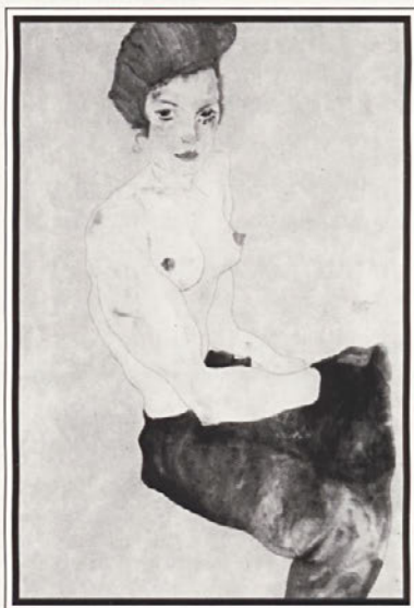
Egon Schiele: SEDEČA ŽENSKA Z GOLIM TRUPOM IN MODRIM KRILOM, 1911