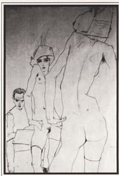
Egon Schiele: SCHIELE RIŠE GOL MODEL PRED OGLEDALOM, 1910

Bližje je vsekakor igra o ljudeh, ki ne sodijo skupaj. Skupaj jih stlači naključje, ki pa nikakor ni nekaj usodnostnega, ampak hladno faktičnega. Vsi nosijo maske. V tem tiči blodnjak. Za žensko psihologi pravijo, da nosi na sebi