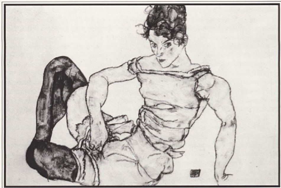
Egon Schiele: SEDEČA ŽENSKA V VIJOLIČNIH NOGAVICAH, 1917