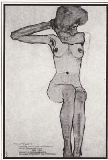
Egon Schiele: SEDEČA GOLA ŽENSKA Z DVIGNJENO DESNICO, 1910

Vendar: kdo je večja žrtev? Ali tisti, ki preživi in obstane v praznem, tistem praznem, ki ga bo nekako skušal napolniti, a bo obstal pri simulaciji, ali pa je večja žrtev tisti, ki ga resnična, nesimulirana praznina (smrt) dokončno po-