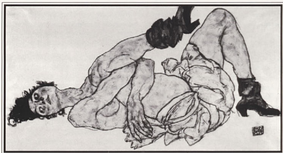
Egon Schiele: ZLEKNJENA GOLA ŽENSKA, 1917

Alice je odšla. Odšla si za vedno in ležiš tam med vsemi temi spomini, nihče več te ne pozna in tvoje ime je pozabljeno. A še vedno