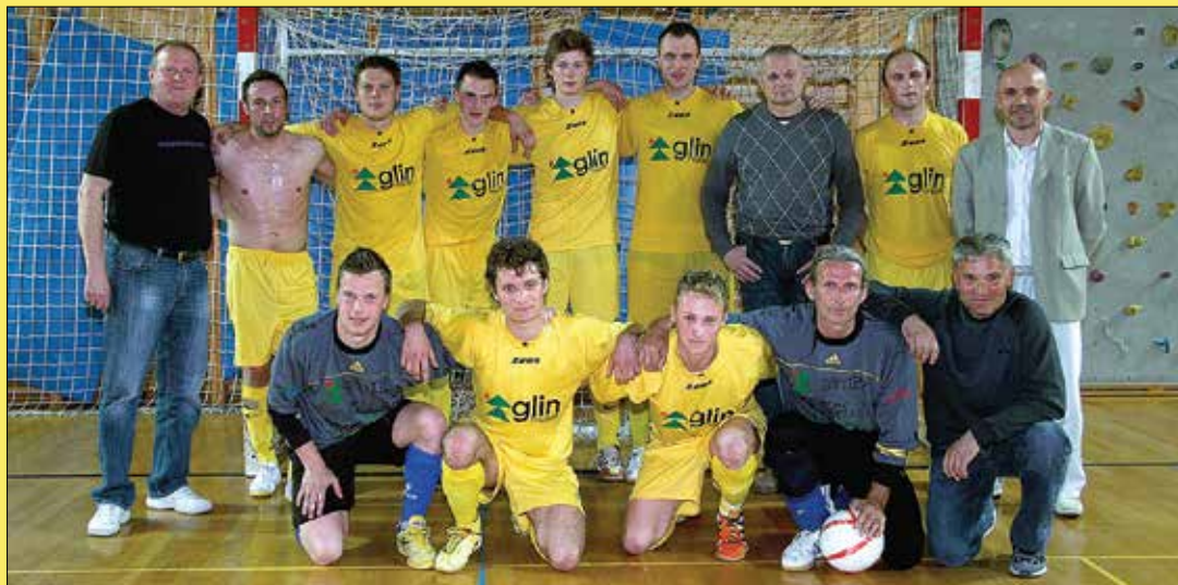
Ekipa Nazarje Glin je izredno uspešno zaključila redni del sezone, kjer je osvojila prav vse, kar jim prvenstvo v tej fazi tekmovanja ponuja.

restavracija - sobe (Arja vas - Velenje) tel.: 03 714 80 60 Marjola - malice (Zalec - center) tel.: 03 710 37 30