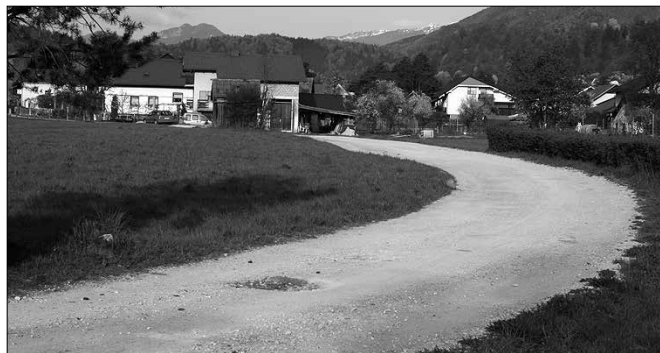
Cesta je bila pred leti kategorizirana kot pešpot, ki pa je bolj ali manj nihče ne vzdržuje.

Med kmetijo Vrhovnik v Lokah in Novimi Lokami poteka pot, ki so jo domačini vedno uporabljali za lokalni promet. Takšnega značaja je bila tudi ta cesta v dolžini okoli 250 metrov, čeprav ni bila prevlečena z asfaltno prevleko in vedno preozka, ko sta se na njej srečali dve vozili. Pred leti je na tej poti preko potoka Ločka struga zrasel nov most, saj je bil star nevaren za uporabo. Ob tem so izvajalci pozabili na ograjo, ki bi uporabnikom preprečila morebiten padec v vodo.