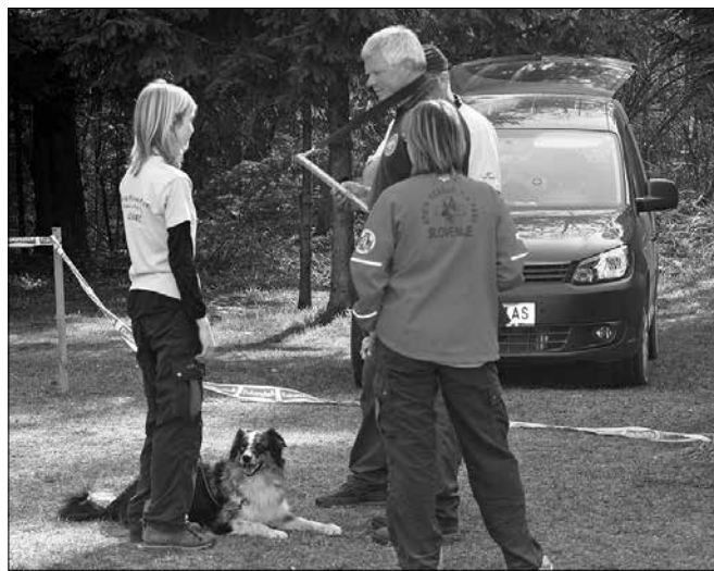
Ob koncu preizkušnje so člani ocenjevalne komisije tekmovalcem razložili svoja opažanja in podelili oceno.

Med 1. in 3. aprilom so se vodniki s svojimi štirinožci pomerili v različnih disciplinah. Na prostoru 100 krat 300 metrov so v gozdu iskali pogrešane osebe, podobno tudi v ruševinah. Seveda je čas iskanja omejen. Izvajali so vaje poslušnosti, med katerimi je moral pes hodi-