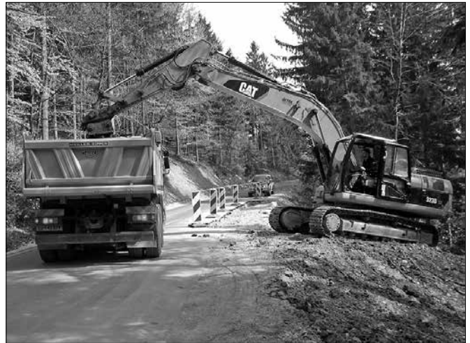
Sanacijo plazu izvaja podjetje GP Pirc.