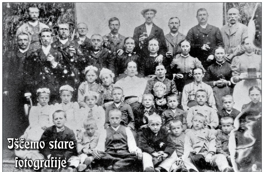
Iščemo stare fotografije

Pri kmetu Gradišniku so mlatili. Skedenj je bil poln mlatičev. Nenadoma pa so vsi psi v vasi divje zalajali. Eden od mlatičev je v šali dejal: »Kar tod mimo ženite.« Pri tem je mislil na lovski pogon. Res je kmalu za tem prilomastil iz gozda velik divji mož, za njim pa trop psov – tako so vsaj mislili mlatiči. Ko je velikan prišel do skedenja, je vrgel mlatiču, ki je vpil lovčemu, človeško nogo in dejal: »Na, tu imaš, ker si mi pomagal loviti.«