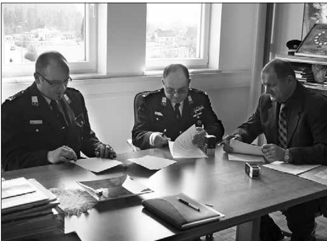
Podpis aneksa k delu pogodbe, ki določa višino finančnih sredstev za nemoteno delovanje mozirskih gasilcev.