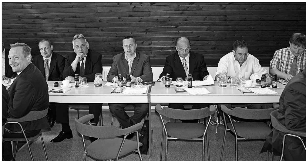
Udeleženci delovnega srečanja so prisluhnili tudi predstavitvi kolesarskega omrežja v Savinjski regiji.