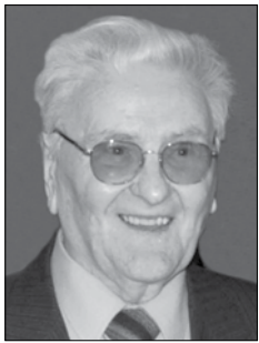
Piše: Aleksander Videčnik