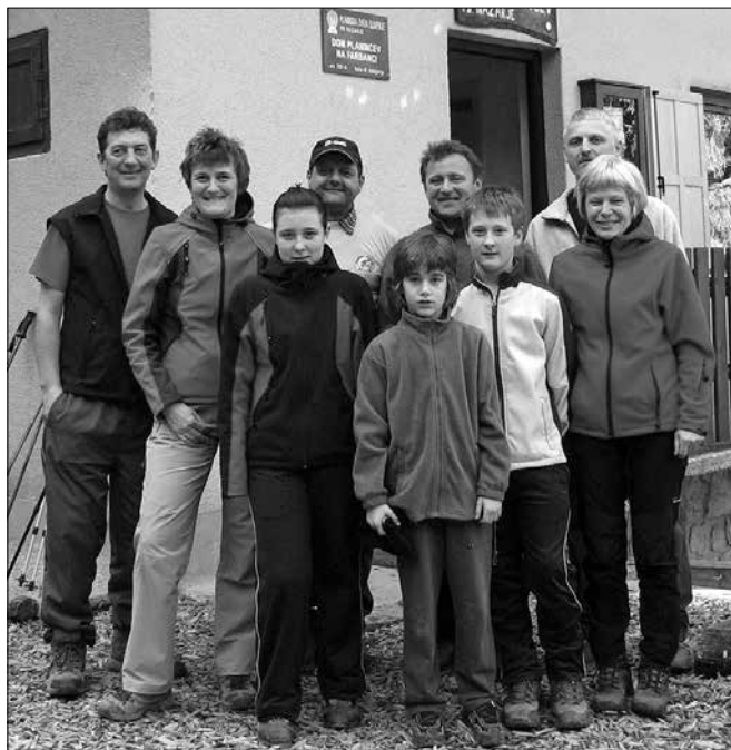
Skupno so pohodniki kočjo obiskali 2.055-krat, kolesarji pa 363-krat.