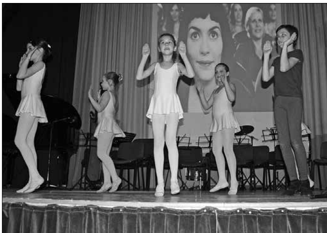
Baletni skupini sta pripravili odlomka iz filma Amelie .