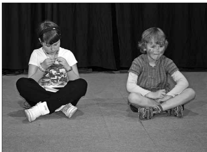
Leponjivski osnovnošolci so staršem podarili zgodbo Toneta Pavčka Juri Muri v Afriki.