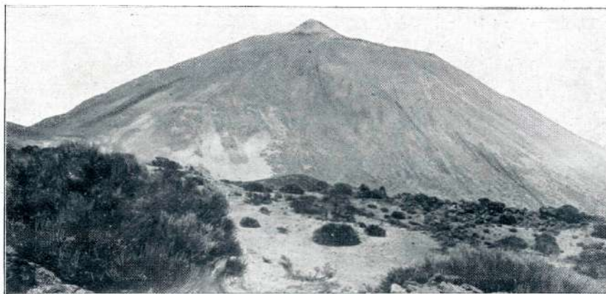
PIC DE TEYDE NA TENERIFI

Prevrat na Grškem. Vojaška zarota proti kralju Juriju bi mu bila kmalu vzela prestol. Prišlo je do prave morske bitke med vstaškimi mornarji, ki jih je vodil Ty-paldos, in med kraljevo zvesto mornarico; zmagali so kraljevi mornarji. Bitka se je vršila pri otoku Salamini (str. 41), koder je nekdanji Temistoklej premagal perzijsko mornarico.