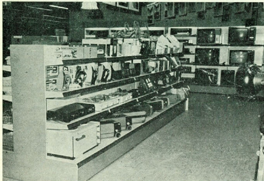
Tehnični oddelek blagovnice

Iz strukture virov financiranja je razvidno, da so TOZD Merx nosile glavno breme investicije. Krediti banke in dobaviteljev opreme ter drugi krediti so najeti z razmeroma kratkimi odplačilnimi roki, zato bo potrebno zagotoviti pomoč pri odplačevanju vseh TOZD Merxa. Čeprav se Merx kot delovna organizacija reorganizira in so se delavci na referendumih izjasnili o formiranju štirih novih delovnih organizacij in sestavljene organizacije Merx Celje, ni bojzani, da bi TOZD prodaja Ruše po reorganizaciji prišla v položaj, da ne bi mogla kriti obveznosti iz naslova te investicije. Delovne organizacije, ki se formirajo iz sedanjega Merxa bodo prevzele vse dosedanje obveznosti in zagotovile tudi nemoten nadaljni razvoj po srednjeročnih načrtih.