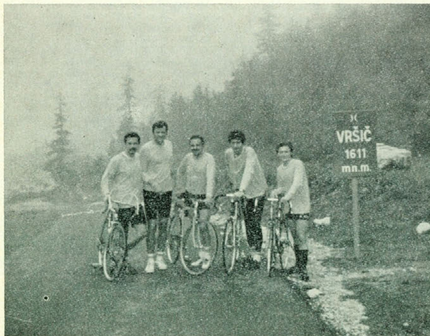
Vzpon na Vršč — 11. avgust 1980

kega kolesarja še kako oznoji. Prihod na 1611 m visoki prelaz je junaško dejanje, ki smo ga tudi mi zmogli.