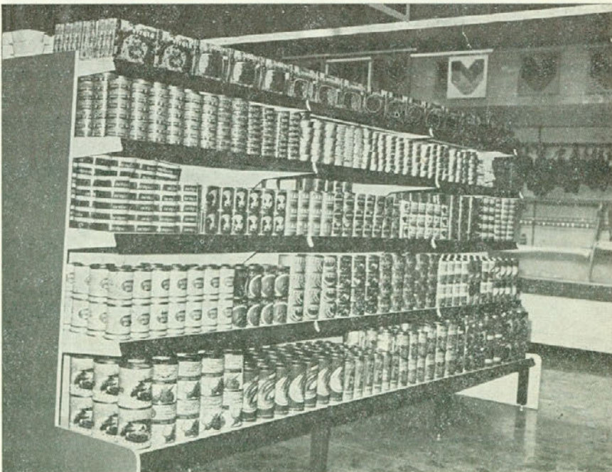
Pogled na živilski del blagovnice

V bifeju bomo nudili tople napitke, širok izbor brezalkoholnih in alkoholnih pijač ter tobaka in tobaknih izdelkov.