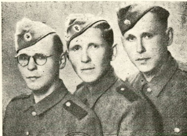
Trije bratje iz družine Weis, Loka — Črnomelj domobraneci skupaj v boju in skupaj v mukah in v grobu

Eno tolažbo pa imamo, ki jo nam daje osma obletnica Vetrinja: Izognili smo se Slovenci v zamejstvu silne nevarnosti, ki nam je pred leti še pretila. Pozaba vseh padlih domobrancev in so-