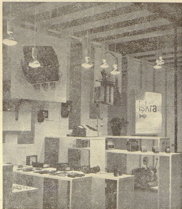
Na sliki je detajl samostojnega razstavnega prostora ZP ISKRA na letošnjem milanskem sejmu, v času med 14. in 25. aprilom. Tovarne našega podjetja so tu razstavile zlasti tisti del svojega proizvodnega programa, ki je zanimiv za italijansko tržišče in za ostale dežele v sredozemskem bazenu. Naši izdelki so bili razstavljeni v hali, specializirani za elektroniko, med njimi pa so zlasti vzbujali pozornost obiskovalcev naši merilni instrumenti, kinoprojektorji, izdelki telefonije, elementi za elektroniko in drugi.