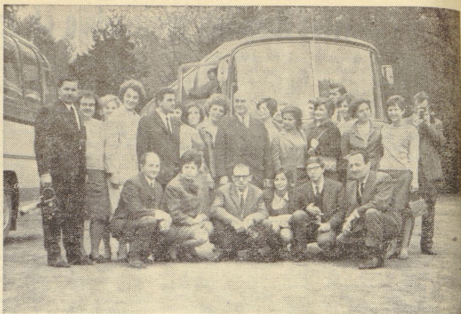
Del udeležencev našega sindikalnega izleta v Prago iz avtobusa št. 5

Dokaz za večjo demokratičnijo, ki so jo in jo še prinašajo spremembe v Češki, pa so bile tudi formalnosti