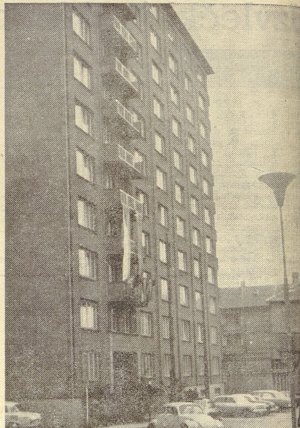
V hotelu »Solidarita« je prebivala večina izletnikov v Prago

»Delavski svet združenega podjetja je organ upravljanja združenega podjetja. Šteje 50—80 članov. Točno število