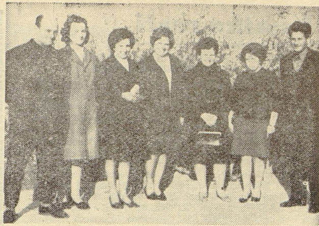
Jubilanti deset in dvajsetletnega dela v tovarni »Avtoelektrika« Nova Gorica