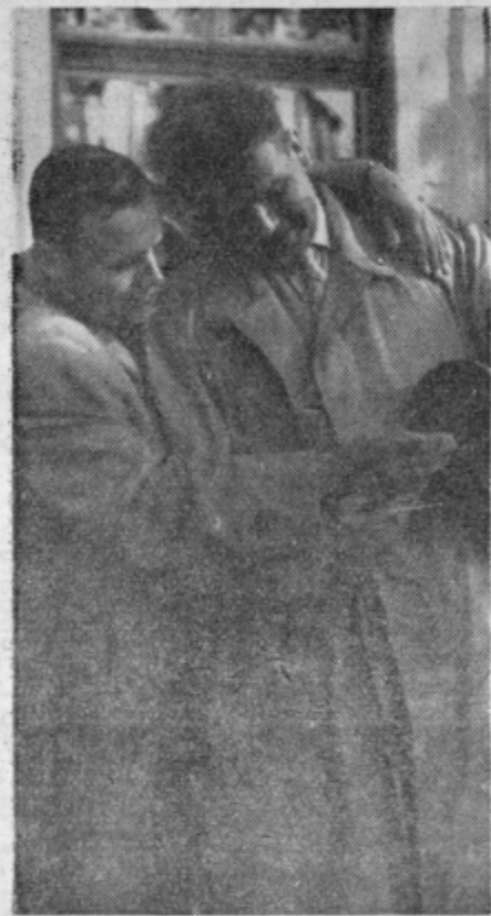
Clane komsomolske delegacije je naš fotoreporter ujel tudi v tem veseljem razpoloženju ob sprejemu v Zrečah

Pred dnevi je priplula v neko angleško pristanišče ameriška trgovska ladja »Jon Serdjent«. Potovanje s to ladjo se razlikuje od ostalih potovanj in je udobnejše. Ta ladja namreč sploh ne vibrira, kakor vse druge ladje, temveč pluje brez tresenja kot na primer jadralnica. Ta ladja ne vibrira zaradi tega, ker jo poganjajo plinske turbine in ima specialen vijak. To je prva večja ladja, ki je brez vibracij.