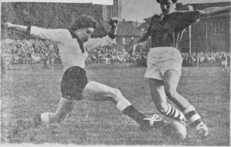
V Zahedni Nemčiji so navdušeni nogometni navijači že lahko videli nežni spol na zelenem polju. Ustanovljeni so ženski nogometni klubi, ki resno vadijo že dlje časa in zadnje čase tudi nastopajo. Pravila so zanje ista kot za močnejši spol. Za pričakovati je, da se bodo enajstotice »nežnega nogometa« spoprijete tudi z možmi. Morda bi celjski nogometaši le uspeli povabiti tak »nežni« tim na svoje igrišče in si priborili zmago v gosti vrsti porazov — ali pa tudi ne.