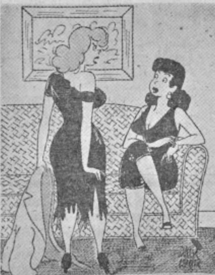
Veš, tako je bil razburjen, da ni vedel, kaj bi pričel z rokami.