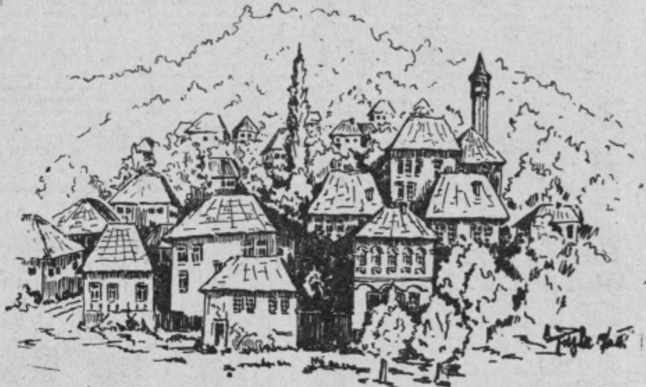
Tone Zoriko: Pogled na staro Tuzlo (risba)

mično industrijo, rudniki soli in premoaga. To polnokrvno sodobno življenje odseva tudi iz naslednjih števil: od vsega zaposlenega prebivalstva tuzlanskega okraja dela 66,7 odstotkov v industriji; od vseh v gospodarstvu zaposlenih ljudi je že 7,9 odstotkov žena; v uradnih in ustanovah zaposlenih ljudi je skoraj polovica, namreč 46,8 odstotkov, ženskega spola... Gospodarski vzpon, h kateremu je znaten delež prispevala tudi mladina z zgraditvijo tamkajšnjega železniškega omrežja, se odraža v širokih, sodobno tlakovanih ulicah, v neonski razsvetljavi, v modernih nasadih, v najmodnejših