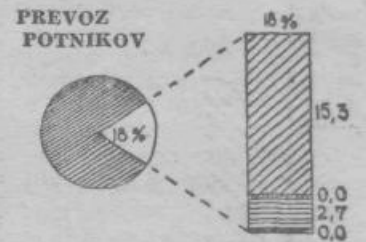
DELEŽ POSAMEZNIH VEJ PROMETA V PREVOZU LETA 1954

Podobno je tudi s prevozom blaga: 78% prevoza opravljajo železnice. Na cestni promet odpade 9%, na rečni 5%, na pomorski pa 8%. To je najboljši dokaz kako velik pomen ima železniški promet za razvoj našega gospodarstva. Hkrati pa iz teh podatkov vidimo da druge vrste prometa, zlasti rečni in cestni, še niso tako razvite, da bi lahko prevzele ustrezajoči del prevoza, zlasti v tistih primerih, kadar sta prevoz s tovornimi avtomobili ter rečni ali pomorski prevoz rentabilnejša ali iz kakršnihkoli razlogov ugodnejša od železniškega.