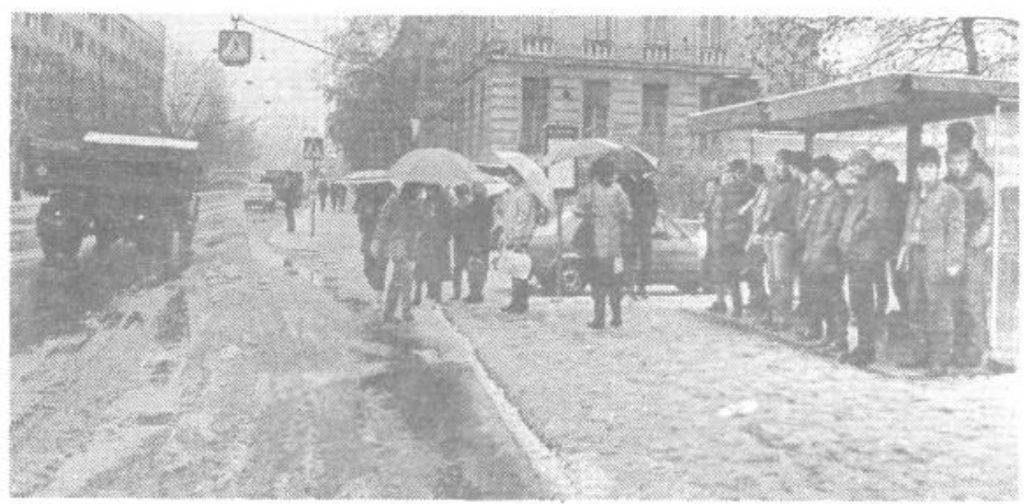
Stalna naloga v cestnem gospodarstvu je namestitev nadstreškov na avtobusnih postajališčih, ki jih je v naši občini že nekaj, so pa izredno dobrodošli predvsem v prihajajočem zimskem času.

Skladno s programom stanovanjske izgradnje poteka tudi izgradnja objektov kanalizacije in vodovoda sekundar sicer za soseske VS-1 Trnovo, VS-3 Žičnica, VS-7 Brdo-Vrhovi (ta objekt je že zaključen), RS-1 RS-2