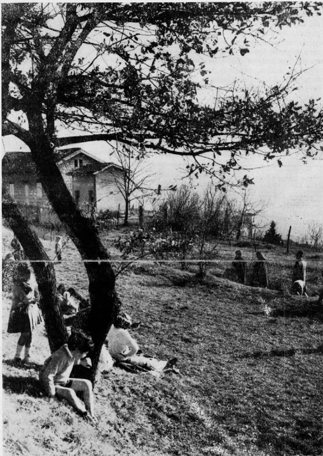
POMLAD V TRZASKEM BREGU

Ta pomen jim je dalo Kristusovo vstajenje, ki je dalo smisel tudi našemu trpljenju in nesre- čam.