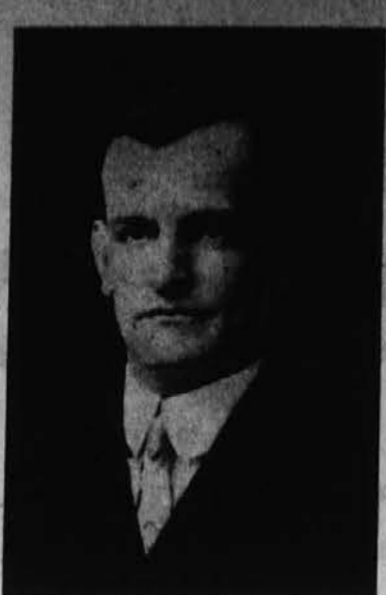
Torenska slika predstavlja našega glavnega zastopnika.