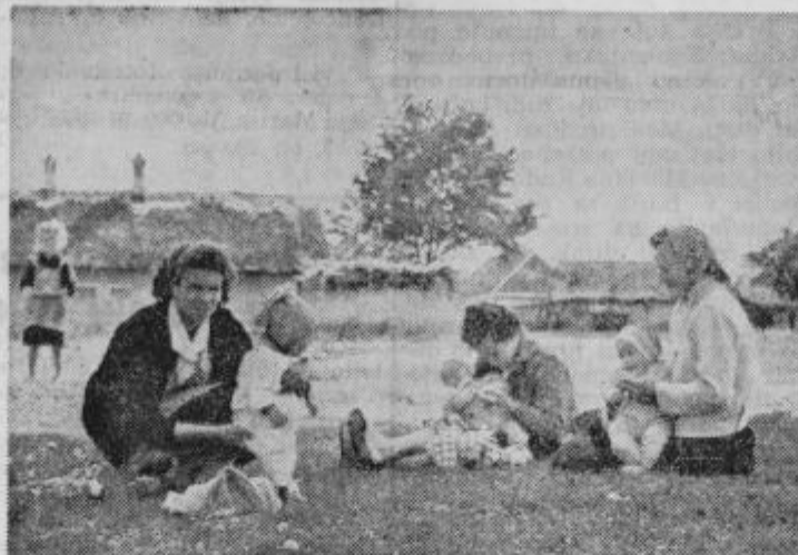
Po posvetovanju v posvetovalnici za otroke na avtobusni postaji v Markoveh

Za območje ptujske občine pa je najbolj razveseljiva ugotovitev, da je znašala umrljivost novorojenčkov v letu 1965 le 2,12 % v primerjavi z letom 1957, ko je bil ta odstotek 5,80