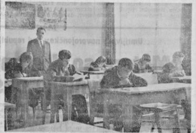
Pri šolski nalogi so navadno vsi zelo resni