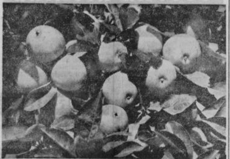
Lepo je pogledati v zdrave jabolane na Panorami in drugod, kjer skrbno negujejo sadno drevje

»Da, pa še kakšna, gospa! Saj je znal tudi angleško!«