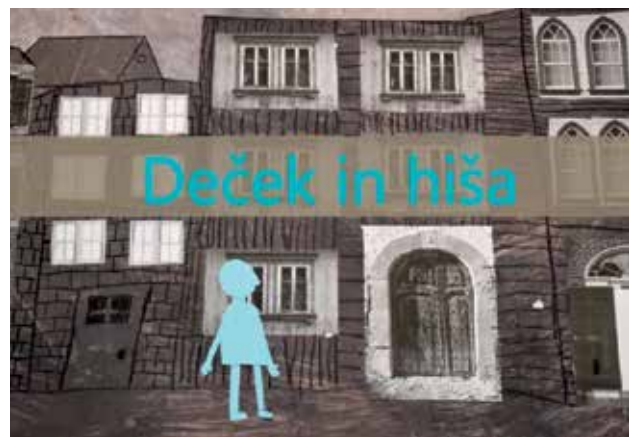
Slika 2: Kader iz animiranega filma.

Liki, ki so jih učenci oblikovali za animacijo, so bili deček, deklica, mačka in trije pešci. Šest likov je bilo izbranih zato, da je vsak učenec lahko oblikoval svojega in ga tudi animiral. Ob likih so učenci oblikovali različna ozadja oz. scene, ki so jih poustvarili po izbranih ilustracijah iz slikanice. Pri oblikovanju posameznih scen so učenci z mentorjem želeli poustvariti prevladujoče razpoloženje v slikanici. Tople harmonične odnose so dosegli tako, da so učenci papirje pred oblikovanjem premazali s sorodnimi barvnimi odtenki. Barvo so nanašali s širokimi čopiči in pršenjem površin. Tako pripravljene podlage so obdelali s pomočjo fotokopij in risbe z belo in črno voščenko. Pri oblikovanju treh glavnih likov so se učenci z mentorjem odločili, da bodo barvo uporabili kot simbol. Deček je modre barve, kar simbolizira razum, deklica je rdeče barve kar simbolizira čustva, mačka pa je črne barve in predstavlja magičnost in skrivnostnost (slike 2–4).