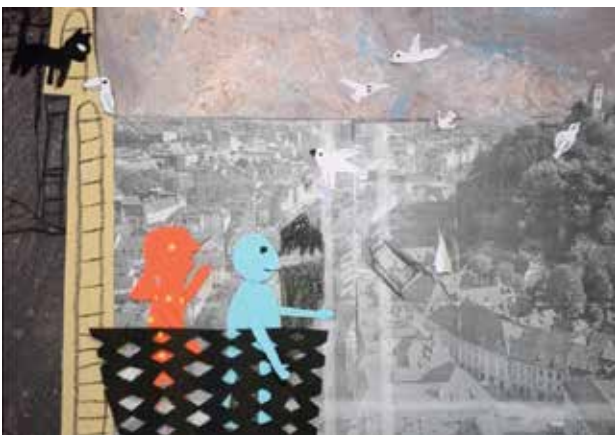
Slika 4: Kader iz animiranega filma.

Montaža je potekala tako, da so pri tem sodelovali vsi učenci, mentor jim je nudil le tehnično pomoč. Največ težav so imeli učenci s smiselnim povezovanjem kadrov in sekvenc v enotno tekočo zgodbo. K temu problemu so pristopili po načelu poizkusa in napake. Prizore so montirali večkrat, in sicer dokler niso bili zadovoljni s hitrostjo menjave slik in prehodi. Montažo so izvedli s pomočjo programa Movie maker .