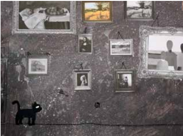
Slika 3: Kader iz animiranega filma.

mačka lovi ptico in pade deklici na glavo. Animacija je nastala po principu stop-motion animacije. Učenci so si med animiranjem delili naloge. Tisti, ki niso bili aktivni pri animiranju likov, so skrbeli za osvetlitev in snemanje s fotoaparatom.