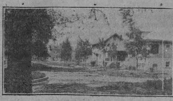
Tukaj se vidijo hiše, ki so na naših lotih.

Pripeljite seboj Vašo družino kakor na pik- nijk. Prodaja se začne ob 10. uri dop.