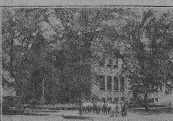
Slika, ki predstavlja šolo, ki se nahaja na naši lastnini.

Le malenkost takoj. Te lote bodo v ponedeljek 14. jun. podražene za $100