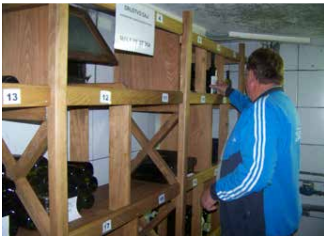
V Filovskem Gaju ima Društvo Gaj lično urejeno vinoteko.

svojih prostorih v Filovskem gaju uredilo lično društveno vinoteko. V vinoteki se hranijo vina od društva in od članov društva in sicer mešana in sortna vina ter rdeča, katerih je bolj za vzorec. Člani društva vsako leto svojo vinoteko dopolnijo z novimi vini, saj napolnijo buteljčna vina, ki so namenjena za promocijo in za razna priložnostna darila. Med 40 vzorcih vin v vinoteki izstopa vino Gajska kapljica. V vinoteki se hranijo vina od leta 2004 naprej in vsako leto se dopolnjuje z novimi vini, od tega so nekatera vina že arhivska, pri čemer nato primerjajo posamezne letnike vin. Vinoteko veliko krat