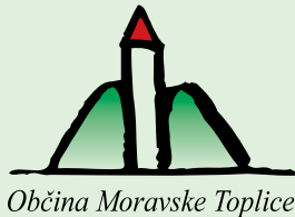
Občina Moravske Toplice