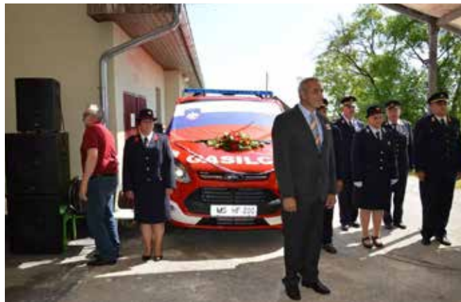
Gasilci iz PGD Suhi Vrh bogatejši za novo gasilsko vozilo.