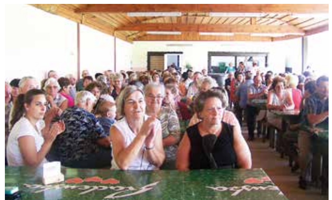
Poletno upokojsko srečanje članov Društva upokojencev Moravske Toplice.