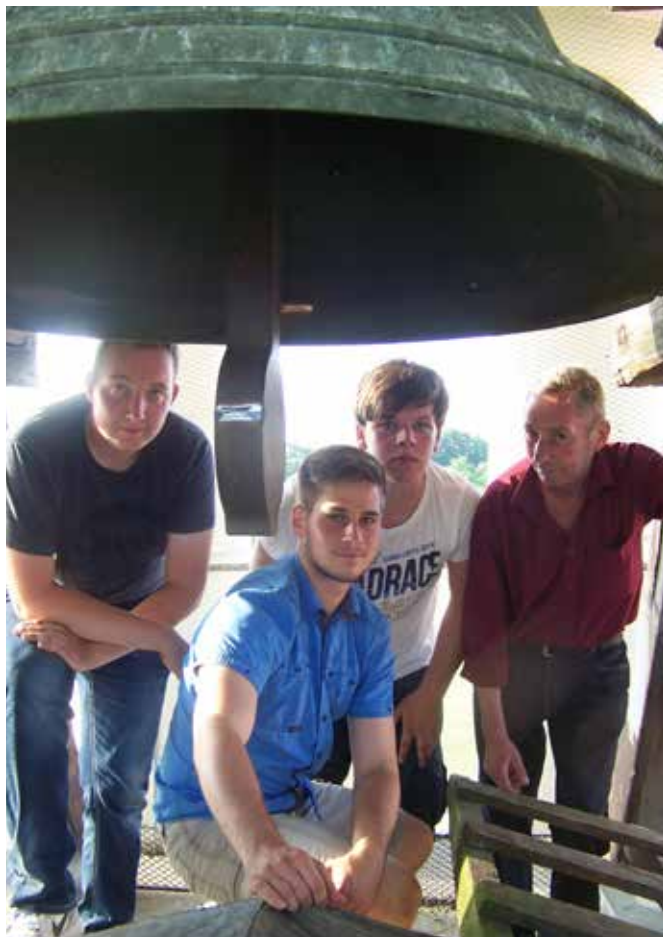
V Bogojini ohranjajo pritrkovanje na cerkvene zvonove.