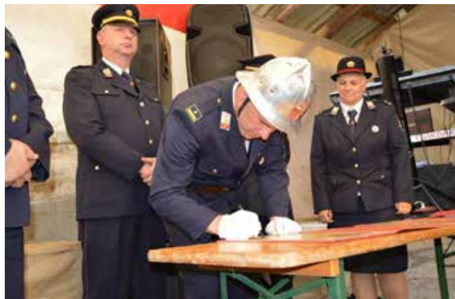
Podpis listine med gasilskim sodelovanjem PGD Suhi Vrh, PGD Gančani in PGD Gornja vas pri Škofiji Loki.