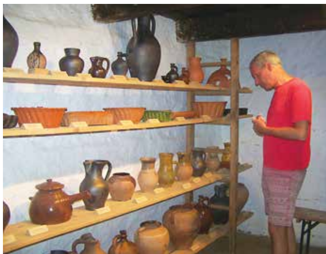
Razstava gline posode.

je tudi staro kmečko orodje katero so kmetje uporabljali pred nekaj desetletij. V tej lončarski vasi so tri hiše, prva je krita z opečno kritino, dve pa sta cimprani in sta kriti s slamo. V eni od hiš je razstavljena glinena posoda, katero je tudi moč kupiti, saj je še v vasi lončar, kateri izdeluje glineno posodo. Gre za pravi ohranjen muzej na prostem, kjer so kolo časa zavrteli za nekaj stoletij nazaj. Tako je Krajevna skupnost Filovci z ostalimi društvi, ki delujejo v tem kraju, v soboto, 27. junija pripravila v Lončarski vasi Filovci deveti festival vina in kulinarike ter hkrati tretje tekmovanje v kuhanju bograča na tradicionalen način, in sicer v lonče-