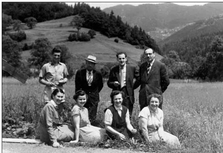
Učiteljice in učitelji nižje gimnazije, 1954.

Učence so bolj zanimalo eksotične države, jasno: Singapur, Tajska, Indonezija, Maldivi, Indija. Pri zgodovini pa stari vek, srednji vek. Spominjam se enega "ocvirka" iz zgodovine, ko smo se pogovarjali o Romulu in Remu. Učenci so pogosto rekli "In volkulja je dojila dva dvojčka, Romula in Rema." Pa sem rekel: "Reci dvojčka, to pomeni, da sta sigurno dva."