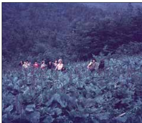
Med in ...

Pridružil sem se planinskemu društvu Železniki, na osnovno šolo pa sem vpeljal planinski krožek, kasneje tudi planinsko šolo. Planinski krožek je nastal delno iz pobude loške transverzale, ki jo je organiziralo loško planinsko društvo. Le-to je potekalo po obrobju takratne loške občine. Celotno pot si prehodil v kakih 60 urah, dobiti si moral vseh 32 kontrolnih žigov, da si prejel spominsko značko. Z učenci planinskega krožka smo delali transverzalo ob koncih tedna. Planinsko društvo je učencem plačalo vožnjo z avtobusom in tako smo v več vikendih prehodili določene etape in v enem šolskem letu celotno pot. Učenci so bili zelo navdušeni in ustanovili smo še planinsko šolo.