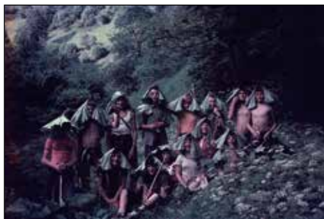
... pod zelenimi klobuki.