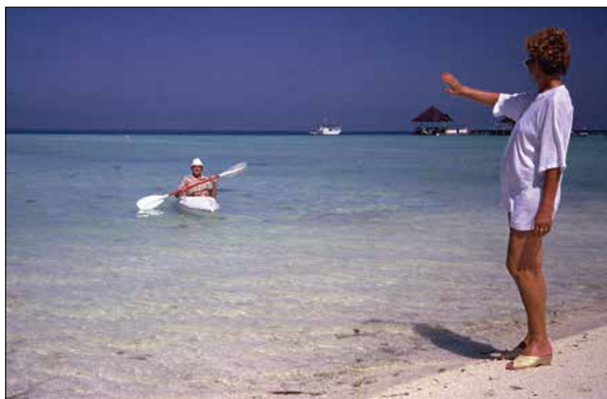
Kani - Finul - Hu, koralni otok.