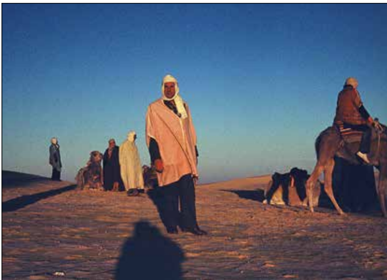
Jahanje proti sončnemu vzhodu, Tunis.