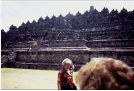
Borobudur na Javi, budistični tempelj.