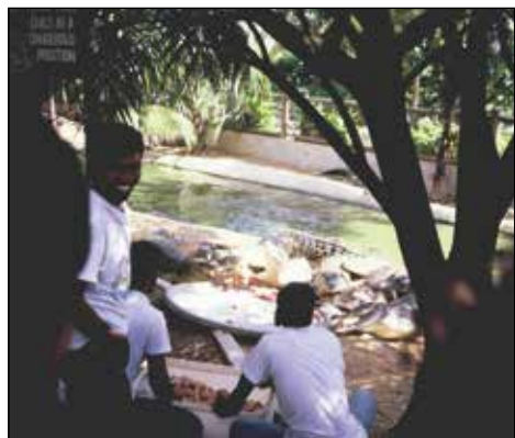
Hranjenje krokodilov, Singapur.