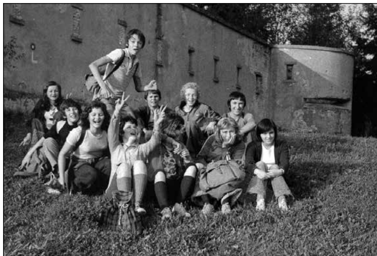
Pohodniki na transverzali, Vrsnik nad Žirmi.