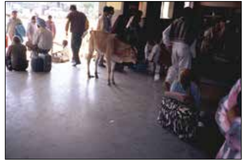
Na železniški postaji, New Delhi.