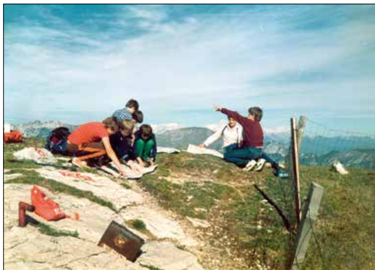
Orientacija v naravi, Porezen.