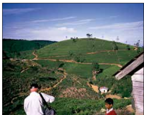
Čajne plantaže, Šrilanka.