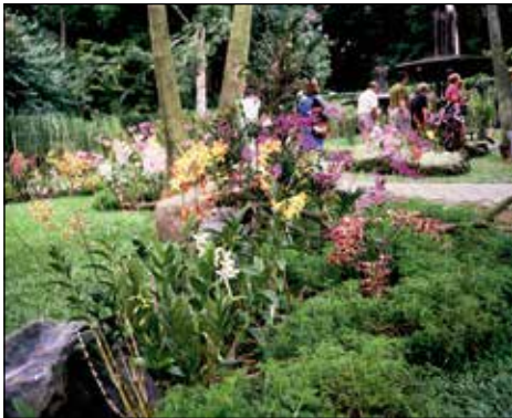
Orhideje v parku, Singapur.