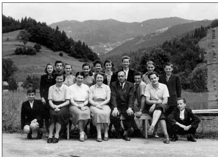
Učitelji in učenci, šolsko leto 1952/53.

Sprva sem ostal doma in pomagal na kmetiji, naslednje leto pa sem v Ljubljani naredil trimesečni administrativni tečaj in se zaposlil na direkciji gradbenega podjetja Gradis. Preselil sem se v Ljubljano