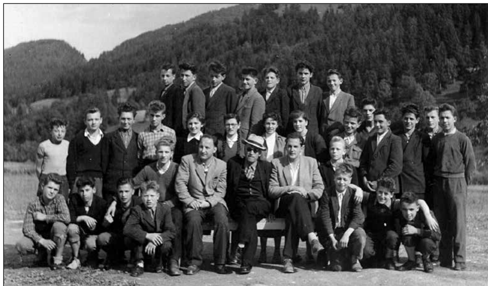
Učitelji in učenci obrtne šole, 1958.

Za časa mojega poučevanja smo šli na taborjenje ob morju, v Fažano. Imeli smo šotore, bilo je res lepo doživeti. Hodili smo v Peroj in v Fažano, mimo neke hiše, rekli smo ji hiša strahov.