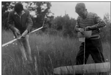
... in tik pred startom.