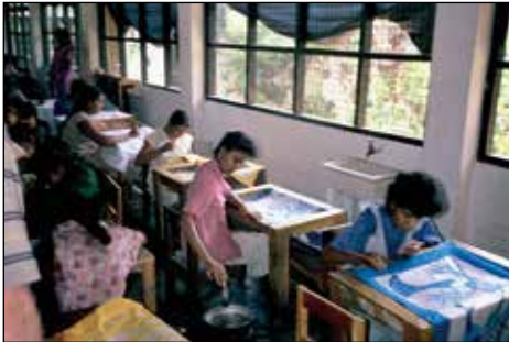
Pouk na Cejlonu.