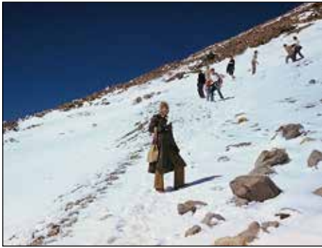
Sprehod na Teido, najvišji vrh Španije.