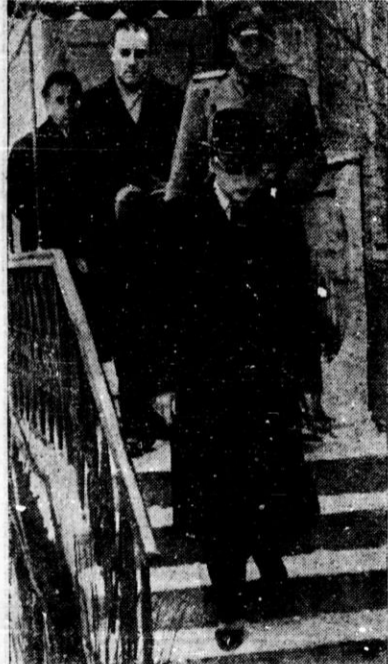
Knez namestnik Pavle odhaja s pokojnikovega stanovanja, kjer je kropil truplo.

Žalostna vest se je bliskovito raznesla po vsem Belgradu in po telefonu po vsej državi. Zaplapolale so črne zastave po vseh mestih, globoka žalost je objela državljane. K smrtni postelji so pričeli prihajati pokojnikovi prijatelji, sodelavci, ministri in drugi odličniki — vsi so se hoteli posloviti od zaslužnega moza. Med drugimi je prišel tudi Nj. Vis. knez namestnik Pavle, ki je izkazal zadnjo čast pokojniku in izrekel svoje sožalje. Med drugim je dejal: „Njegova izguba je velika izguba. Z njim nisem izgubil samo velikega državnika, temveč tudi dobrega osebnega prijatelja.“