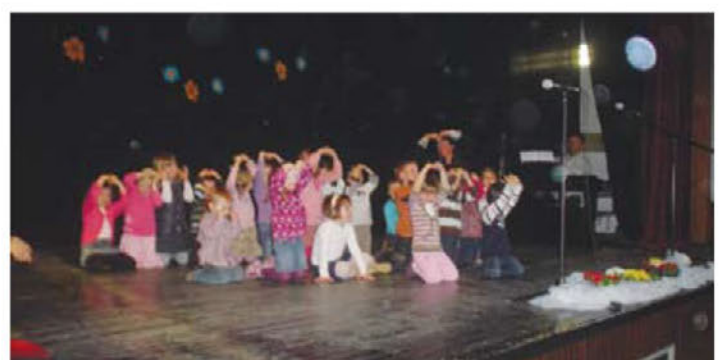
Proslava ob materinskem dnevu ( nastop )