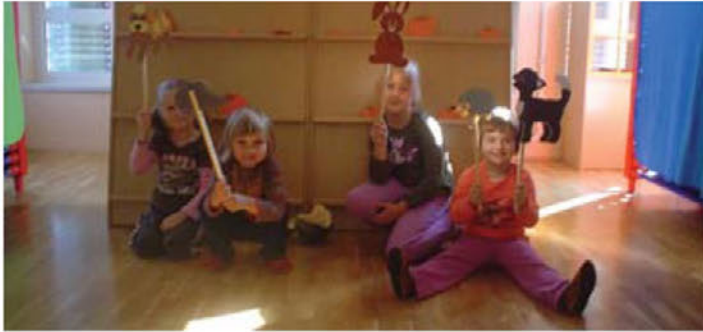
Lutkovna igrica ( Razbita buča )

»Vrtec je mesto, kjer solze ob poslavljanju posuši igra, kjer lutke in pesmi zvabijo iskrice v oči, kjer je vsa pozornost posvečena le njim – našim najmlajšim«.