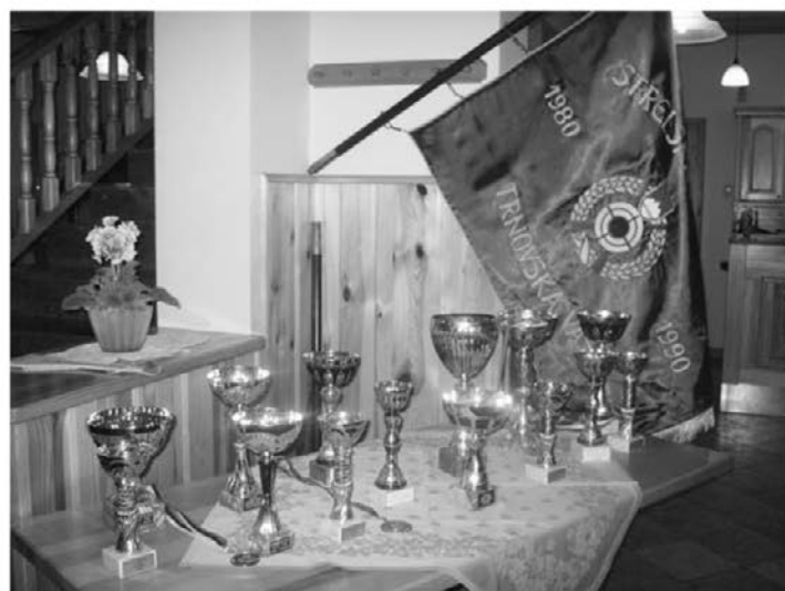
Zbirka pokalov in medalj v sezoni 2009/2009