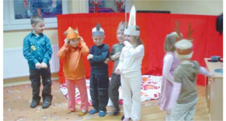
Projekt Mojca Pokrajculja ( dramatizacija )