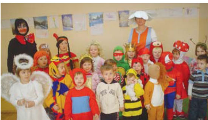
Norčavi pust v vrtcu ( pustno rajanje )