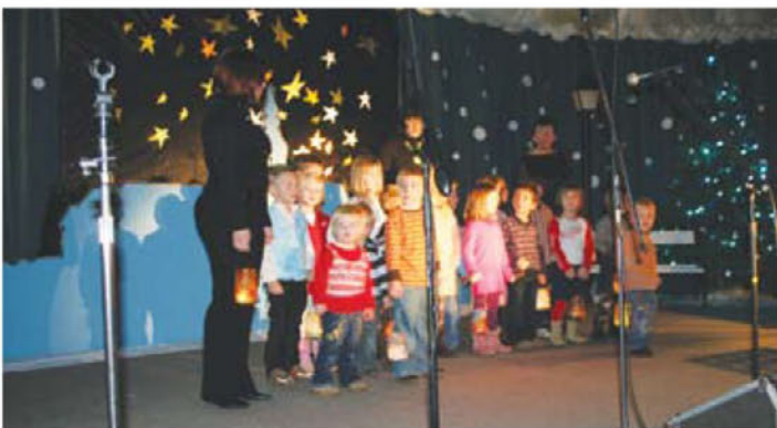
Božično-novoletni koncert ( nastop )