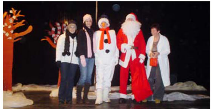
Predstava za Božička ( Snežak je zbolel )