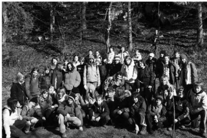
Na poti, po ogledu jame Kobiljača