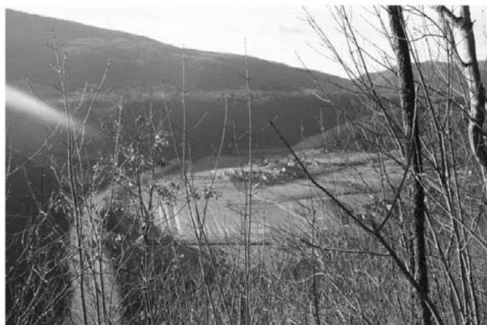
Pogled na vasico Radenci iz Velike stene - Kal