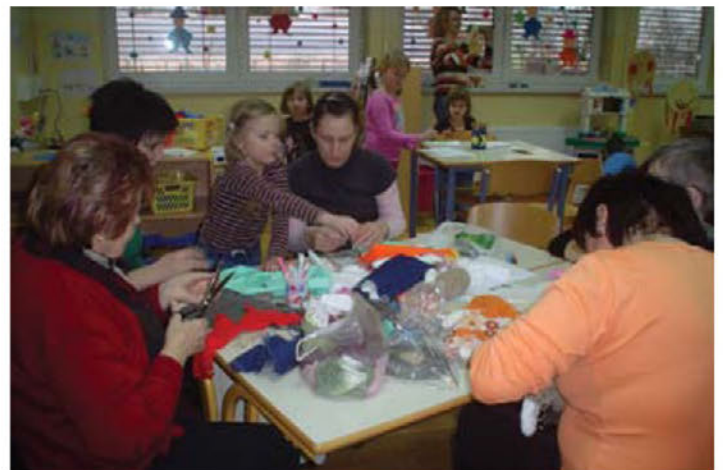
Medgeneracijsko srečanje ( druženje )