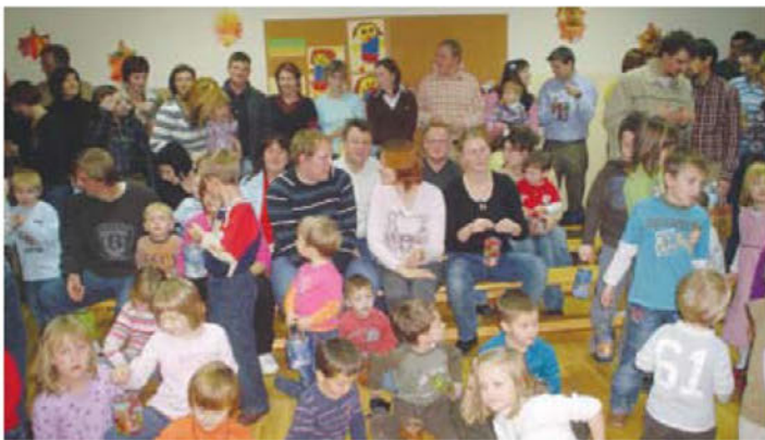
Delavnica s starši ( izdelovanje svetilk )