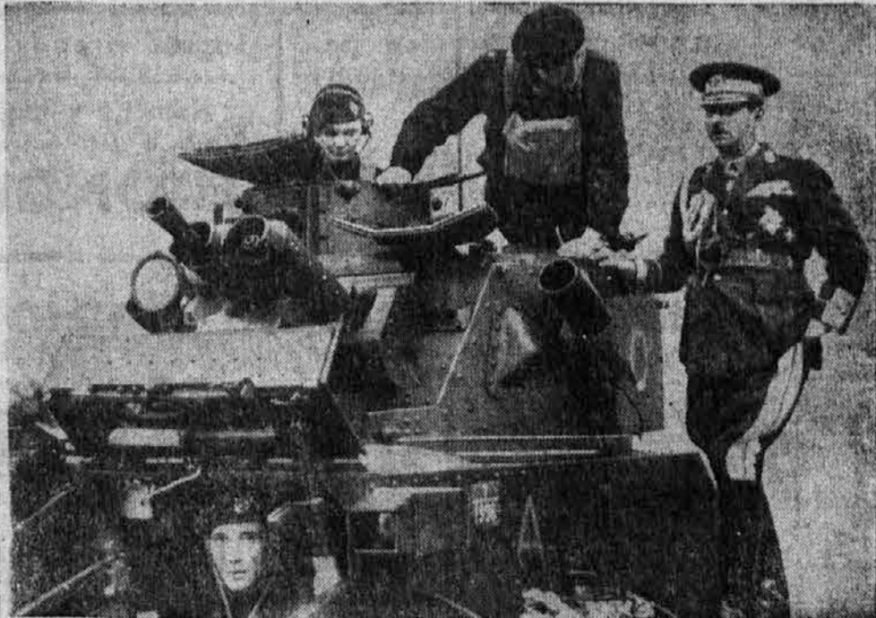
Romunski kralj na britanskem tanku.