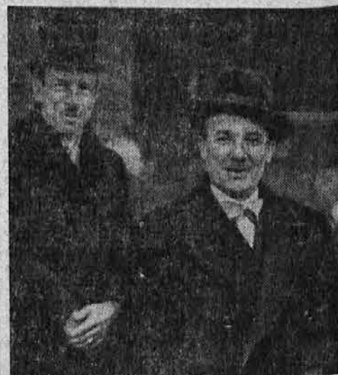
Francoski poslanik Coullondre v Berlinu, ki igra pri francosko-nemških dogovorih veliko vlogo.

□ Slavni italijanski dirigent Arturo Toscanini , ki je znan tudi kot nasprotnik fašizma, bo zaprosil za ameriško državljanstvo.