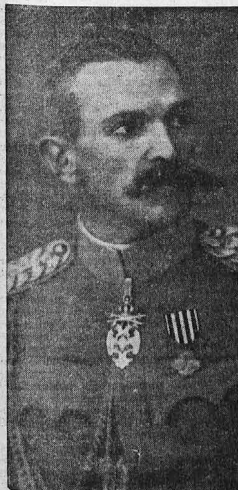
General Rudolf Maister