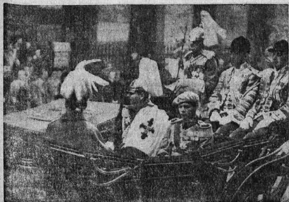
Romunski kralj na obisku v Londonu.