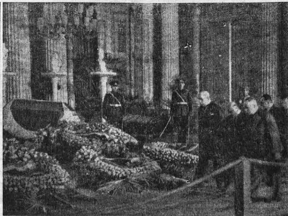
Krsta prvega turškega predsednika Atatürka. Tri dni se je ljudstvo v Carigradu poslavljalo od svojega voditelja, dokler ga niso prepeljali v Ankaru, kjer bo ostala krsta v palači etnografskega muzeja dokler ne zgradijo grobnice.

Velik del Ukrajincev je ostal izven sovjetskih mej. Dočim je bila antanta pripravljena, da pridruži državi Petljure vse ukrajinsko ozemlje, je hotela narediti proti boljševiški Ukrajini močan jez. Največji