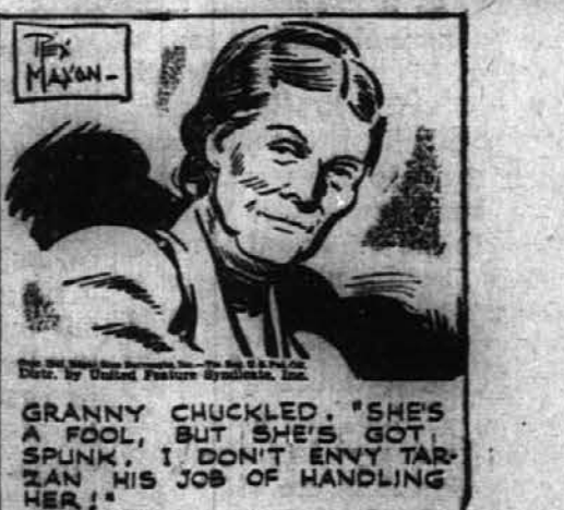
GRANNY CHUCKLED. "SHE'S A FOOL, BUT SHE'S GOT SPUNK. I DON'T ENVY TARZAN HIS JOB OF HANDLING HER."

Ko ji je Tarzan odvzel veržico, je Darena vzkričala: "Sirovež! Ne upoštevaj, kdo sem jaz!" Srečo je gledala Darena, ko je Granny nadaljevala: "Mi smo v težavnem položaju, iz katerega se ne vidimo brez poirtvovanja." "Nočem, da bi me podučevali navadni ljudje," odvrne Darena jezno in odide. "Neumnica," si misli Granny; toda Tarzan mora biti previden!