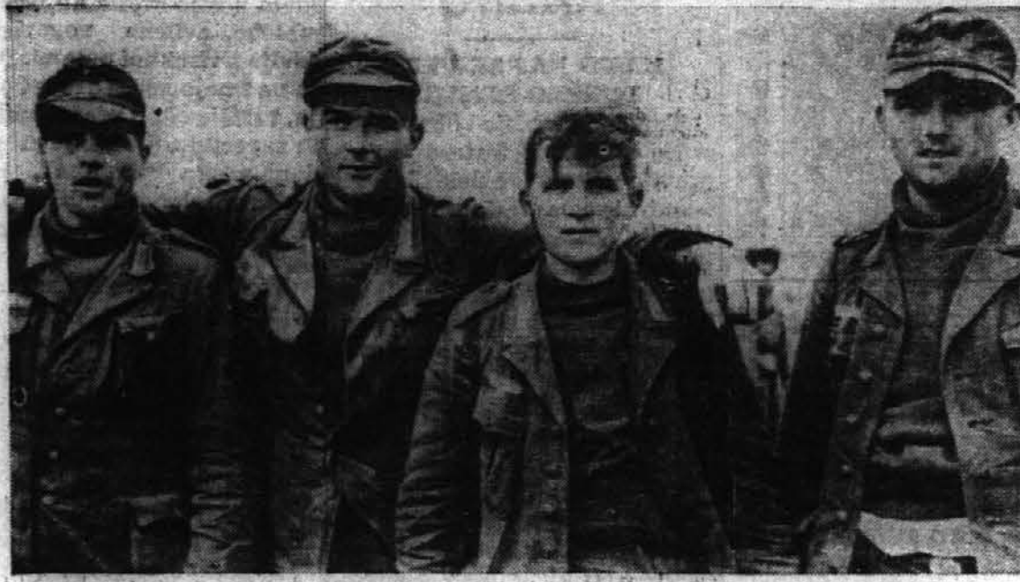
Na sliki je videti štiri nemške ujetnike, ki so jih ujeli zavezniki v Tuniziji. Najmanjši, ki izgleda komaj 15 let, je izpovedal, da je 20 let star.

di s silo jemati, kadar se jim hrana ne da radovoljno" — in tako dalje.