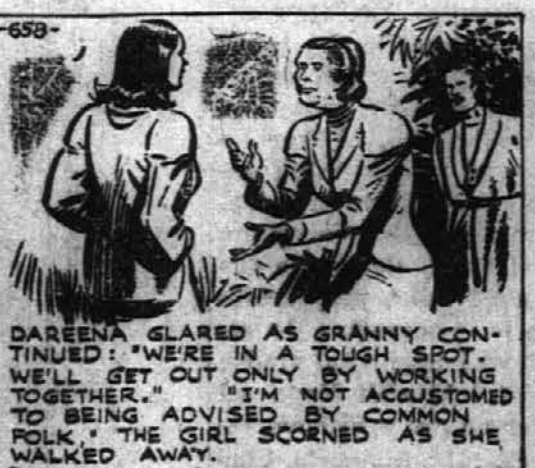
DAREENA GLARED AS GRANNY CONTINUED: "WE'RE IN A TOUGH SPOT. WE'LL GET OUT ONLY BY WORKING TOGETHER." "I'M NOT ACCUSTOMED TO BEING ADVISED BY COMMON FOLK." THE GIRL SCORNFUL AS SHE WALKED AWAY.