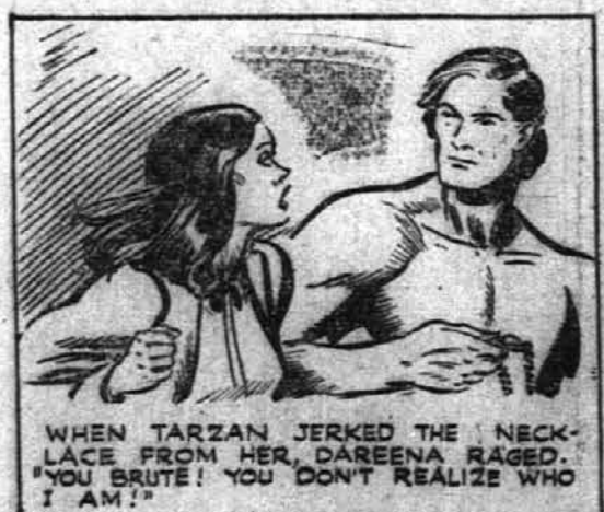
WHEN TARZAN JERKED THE NECK-LACE FROM HER, DAREENA RAGED. "YOU BRUTE! YOU DON'T REALIZE WHO I AM!"