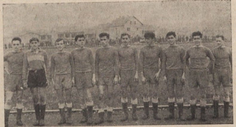
Mladinsko moštvo, ki bo s svojo vestnostjo doseglo še velike uspehe