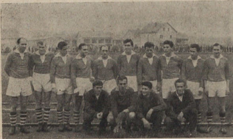
I. moštvo NK Slovan — spomladi še bolje

neuspeh proti Proletarcu v Zagorju — in Slovan je bil ob koncu prvenstva trdno na prvem mestu s štirimi točkami naskoka. Sledile so še kvalifikacijske tekme za vstop v SCL. Odlična igra v Ptujju proti Dravi, še bolj učinkovita igra v povratnem srečanju na domačem igrišču, nato pa še lahko delo proti Taboru iz Sežane in I. moštvo Slovana se je ponovno znašlo v družbi starih znancev — v družbi najboljših slovenskih nogometnih enajstoric.